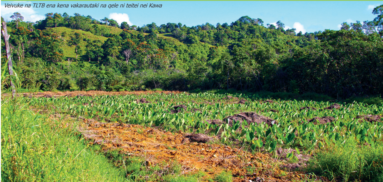
Veivuke na TLTB ena kena vakarautaki na qele ni teitei nei Kawa