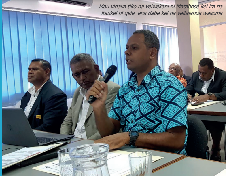
Mau vinaka tiko na veivekani ni Matabose kei ira na itaukei ni qele ena dabe kei na veitalanoa wasoma

yavusa era se sega ni saini, me rawa ni rawati nai wiliwili e gadrevi.