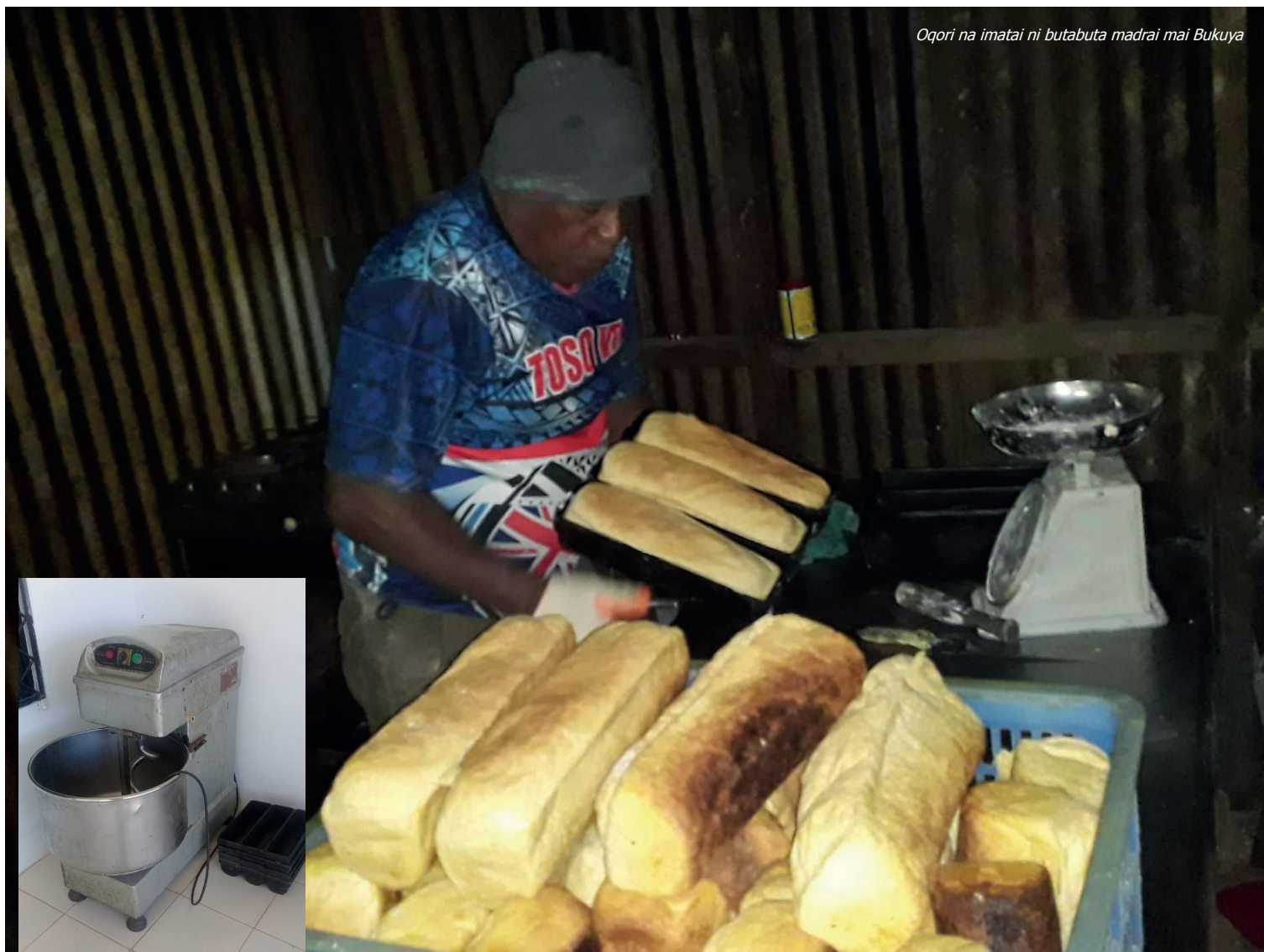
Oqori na imatai ni butabuta madrai mai Bukuya

Na term deposit e dua na iwalewale ga ni vakatubu ilavo ka dau vakadeitaki taumada na kena tubu, na balavu ni gauna me bula tiko kina kei na kena saumi na dinau ni bera ni tekivutaki. ■