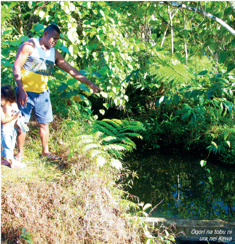
Oqori na tobu ni ura nei Kawa