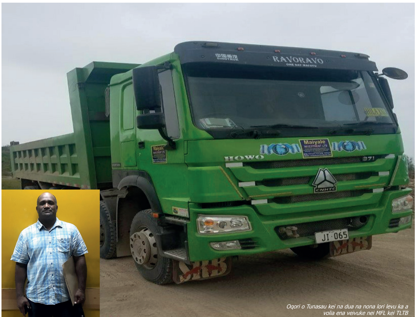
Oqori o Tunasau kei na dua na nona lori levu ka a volia ena veivuke nei MFL kei TLTB