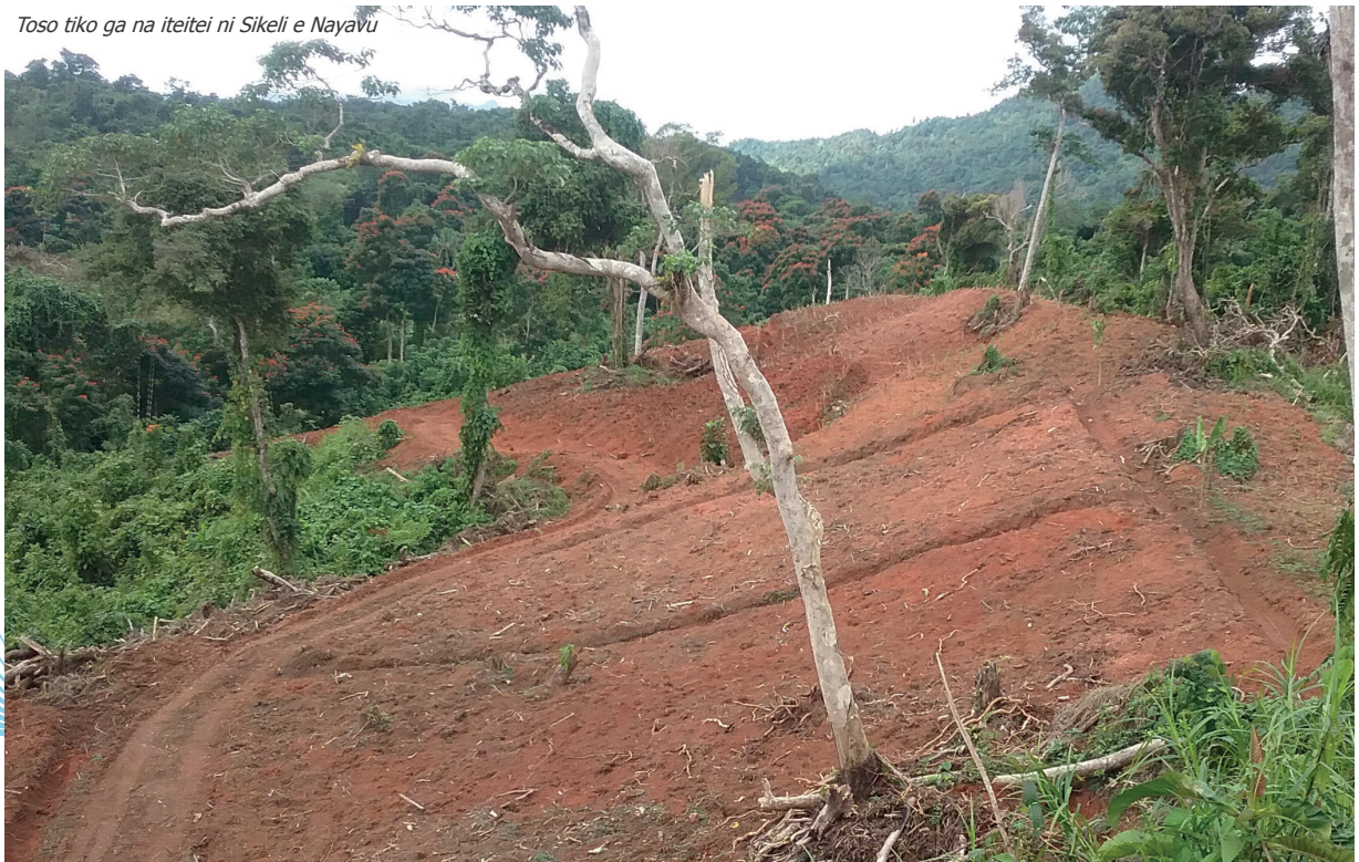
Toso tiko ga na iteitei ni Sikeli e Nayavu

E sa tamusuka oti tale ga o Tuikoro e dua na loga nona ni Ginger o ka rauta ni $4,000 nai lavo e rawata mai kina. E levu tale na veimataqali itei e kune enai teitei oqo ka sa tiko na vakanuinui ni na toso vinaka sara. ■