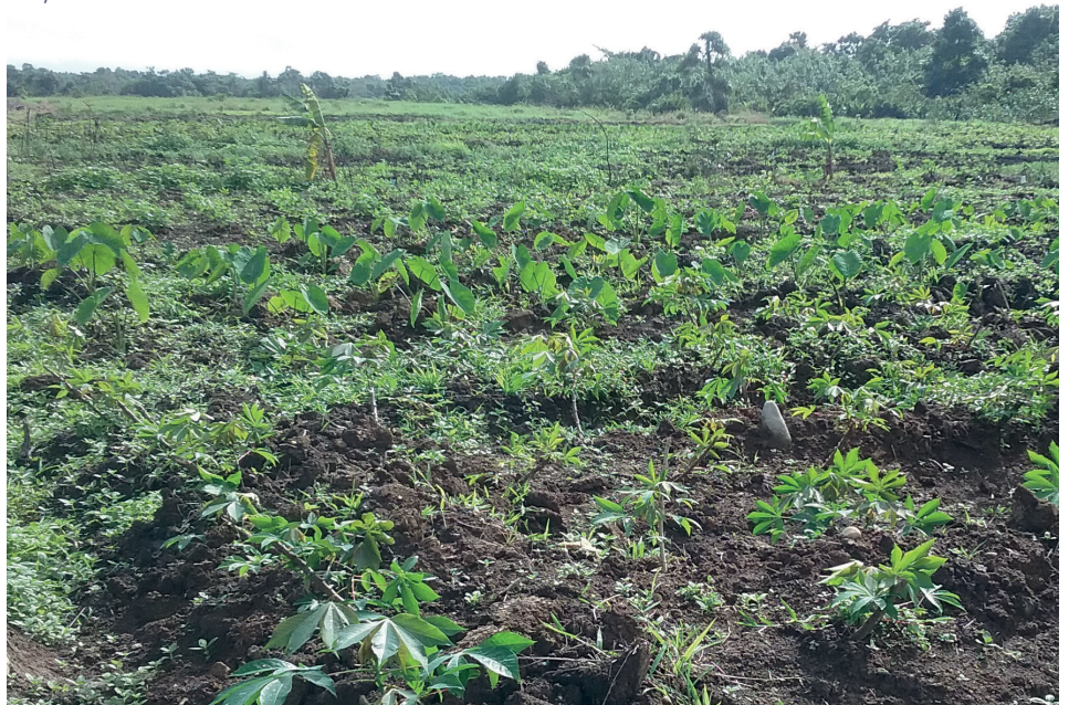
Oqori na iteitei nei Tudravutu e Waikete

E tiko tale ga na lalawa nei Tudravutu me na vakarabailevutaka na nonai teitei ka me dua vei ira na kena dau ena buturara ni vakayagataki qele. E tiko ena nonai tuvatuva me na vaqara tale eso na qele e lala tu, me na lisitaka, sega walega ni vagolei ena teitei, me qaravi talega kina na veivakavaletaki se na real estate development . ■