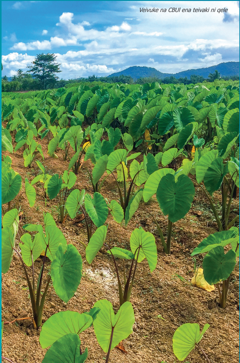
Veivuke na CBUL ena teivaki ni qele

Na veivuke ni Matanitu oqo, e dua ka veivakaugeti sara vakalevu vei ira nai taukei ni qele mera vakadonuya na kena lisitaki na nodra qele e sega ni vakayagataka tu ka vakarawarawataka talega na kena vakavou ni lisi ni teitei. ■