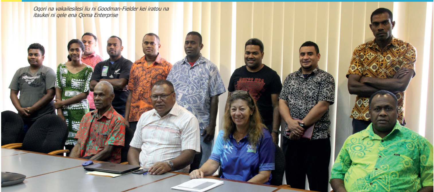
Oqori na vakaillesilesi liu ni Goodman-Fielder kei iratou na itaukei ni qele ena Qoma Enterprise

Na Matabose (TLTB) ena qai vakacuruma ga nai lavo kina akaude vakarautaki kevaka esa vakamuri vakavinaka nai tuvatuva e davo koto e cake. ■