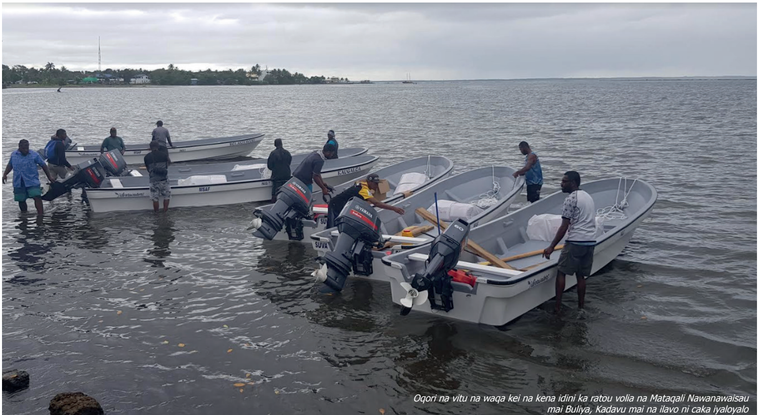
Oqori na vitu na waqa kei na kena idini ka ratou volia na Mataqali Nawanawaisau mai Buliya, Kadavu mai na ilavo ni caka iyaloyalo