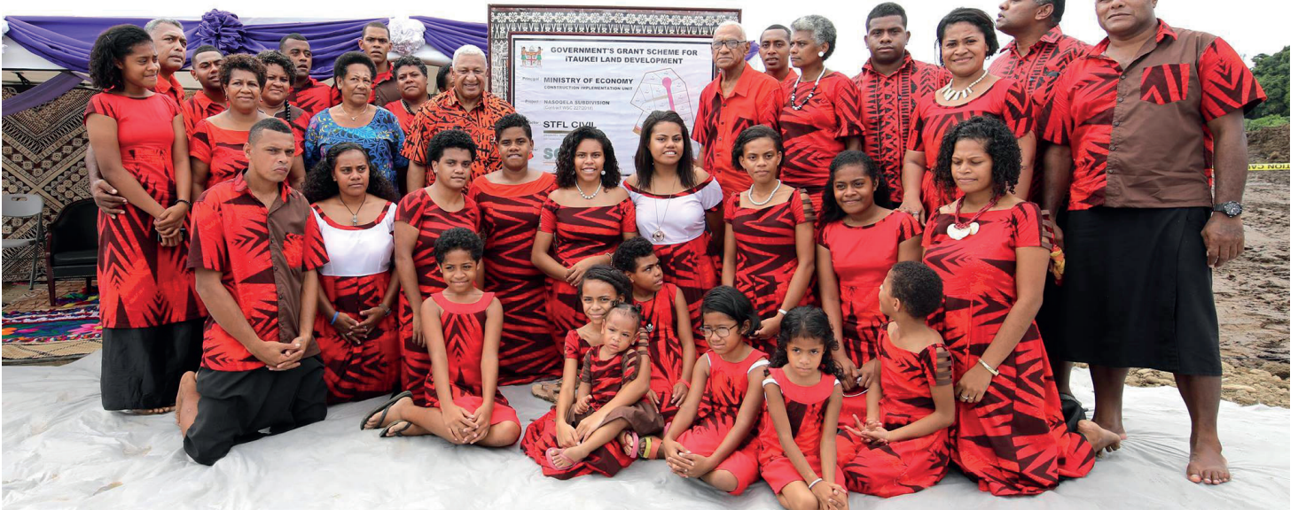
O Roko Tui Namata kei na nona matavuvale ni oti na dola ni Halaiwalu Subdivision ena yabaki oqo kei nai Liuliu ni Matanitu

Nai lavo taucoko e vakayagataki ena kena tara e dua na vale e rauta ni $60,000 na kena isau. ■