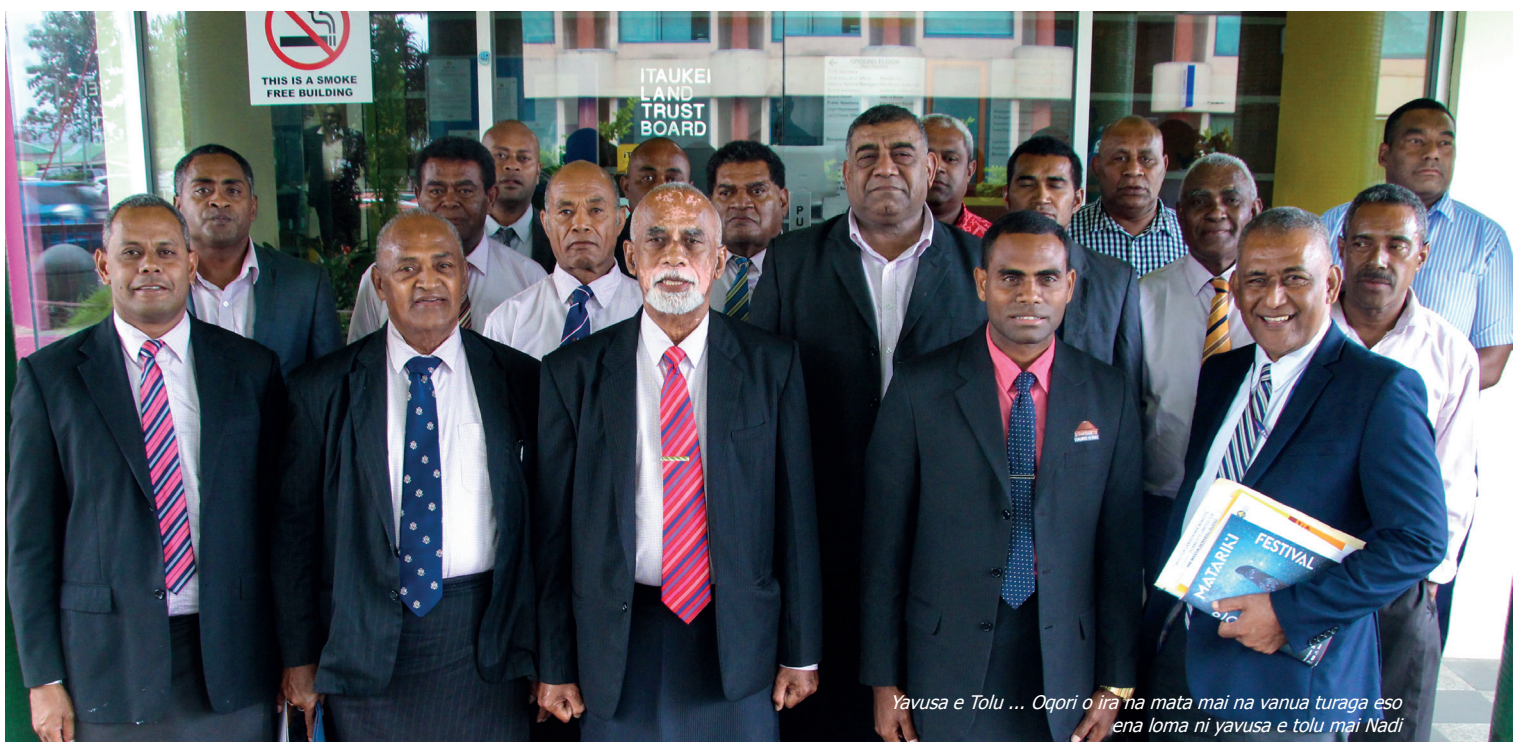
Yavusa e Tolu ... Oqori o ira na mata mai na vanua turaga eso ena loma ni yavusa e tolu mai Nadi

Ni keimami sarava lesu nai tosotoso oya, esa vakauqeti keimami me keimami vakatoroicaketaka mada ga na neimami qele