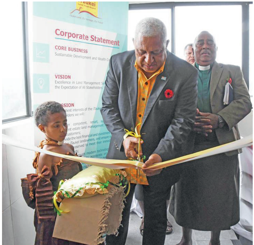
Oqori na dola ni valenivolavola ni TLTB mai Nausori ena 2018

E dua tale tiko ga na kena inaki bibi oya me rawa ni ra lisitaka ga o ira na itaukei ni qele na nodra dui qele ka vaka kina na kena kau yani vakavoleka na veiqaravi eso ka dau mai qaravi tu ga ena noda veikorolelevu me vakataki Suva kei Lautoka kina veitauni eso me vakataki Rakiraki, Korovou, Sigatoka kei Savusavu. ■