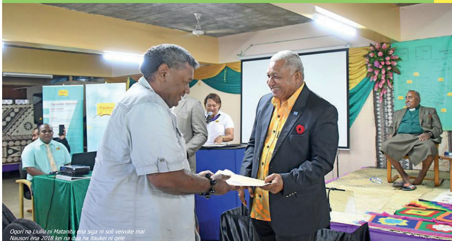
Oqori na Liuliu ni Matanitu ena siga ni soli veivuke mai Nausori ena 2018 kei na dua na itaukei ni qele

E nanumi tale tiko ga ni oqo e rawa ni dolava na katuba vei ira na itaukei me ra lisitaka ga na nodra dui qele