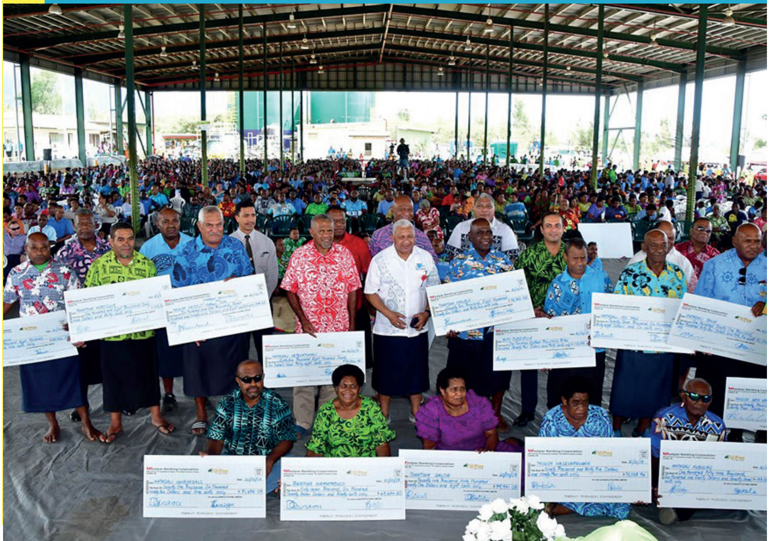
Na iLiuliu ni Matanitu o Voreqe Bainimarama kei ira na itaukei ni qele ena soli ni bonisi ni paini mai Lautoka