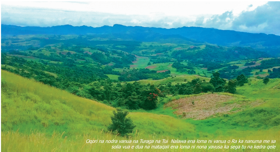
Oqori na nodra vanua na Turaga na Tui Nalawa ena loma ni vanua o Ra ka nanuma me sa solia vua e dua na mataqali ena loma ni nona yavusa ka sega tu na kedra qele

E laurai na nona yavavala na turaga oqo ena levu ni nona marau ka salavata na lomatarotaro ni lomana kei na nona lomatarotaro se sai tukutuku dina beka oqo se sega. E nanuma ga ni tadra tiko. E