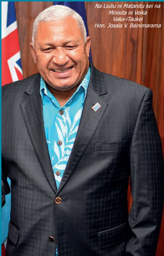
Na Liuliu ni Matanitu kei na Minisita ni Veika Vaka-iTaukei Hon. Josaia V. Bainimarama