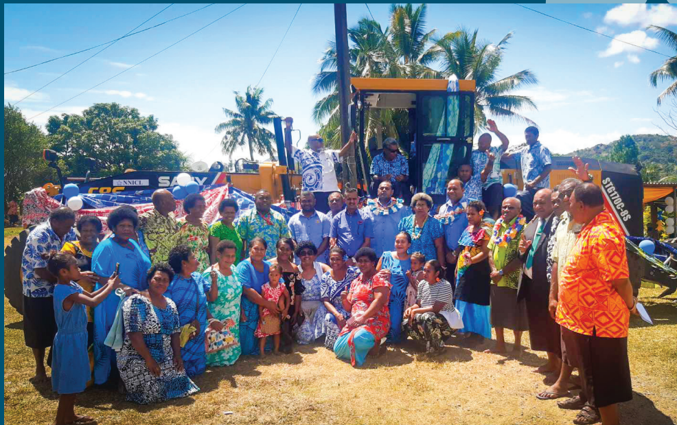
Na lewe ni mataqali Nakoro taba toka oqori vata kei ira na ivakalesilesi ni Matabose ka marautaki tiko na nodra katavila vou ni mataqali

Ia sa kena gauna me wasei yani ka tukuni ka taki yani na tatadra ni matabose. Me ra vaqacacotaki nai taukei ni qele, me ra gumatua. Me ra cakacaka vakaukauwa, ka me kakua walega ni ra tauca na vuana, me ra na tauca vakakia o ira na nodra kawa era muri mai. Na cavu isausau vakaoqo, e ivakadinadina bula ni duavata, kei na lomavata ni lewe ni mataqali. ■