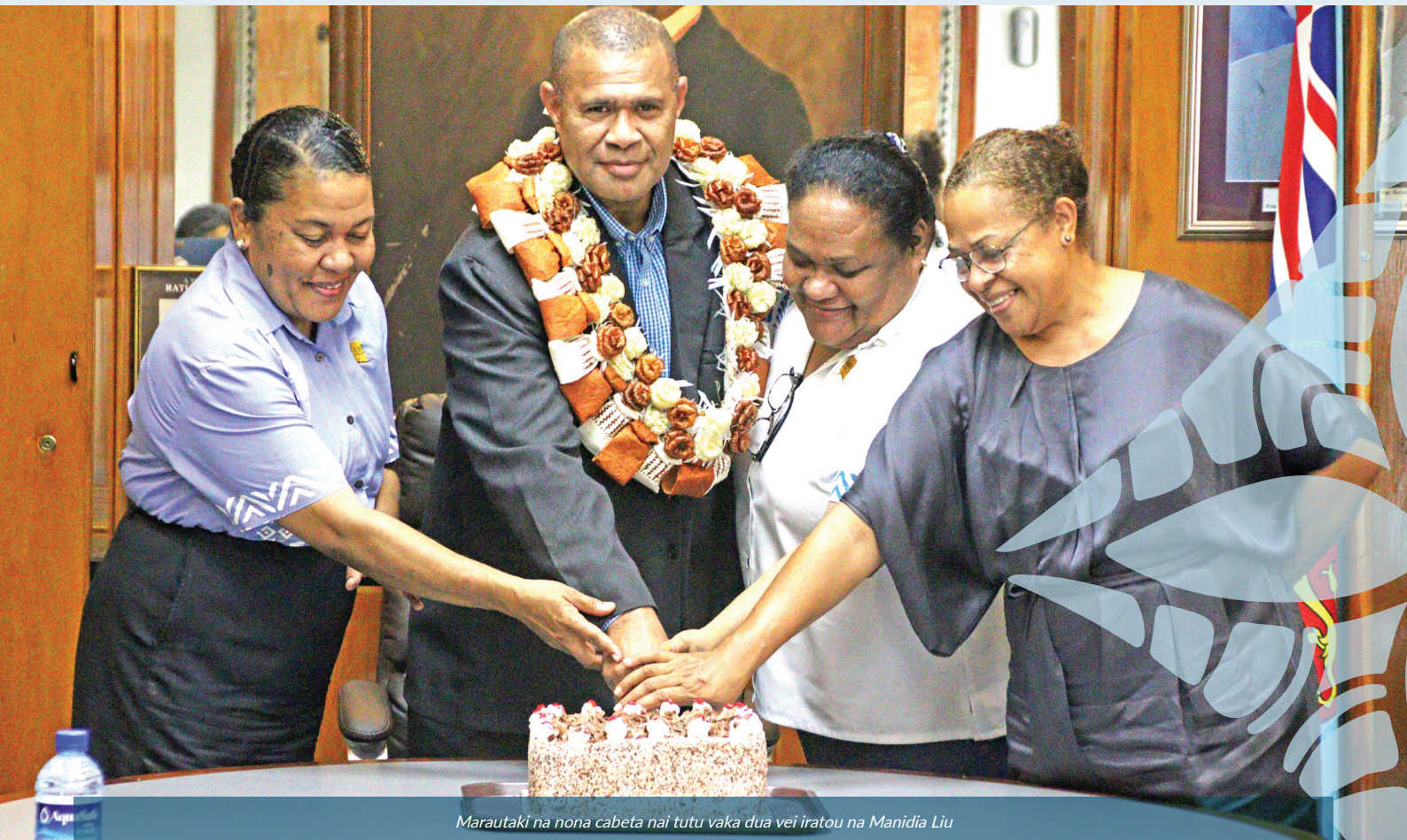
Marautaki na nona cabeta nai tutu vaka dua vei iratou na Manidia Liu