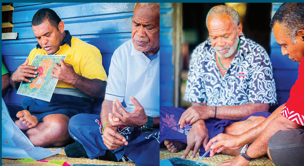
O iratou na vakaillesilesi ni Matabose e na nodratou veivakararamataki tiko vei iratou na lewe ni Yavusa o Nacaqaru