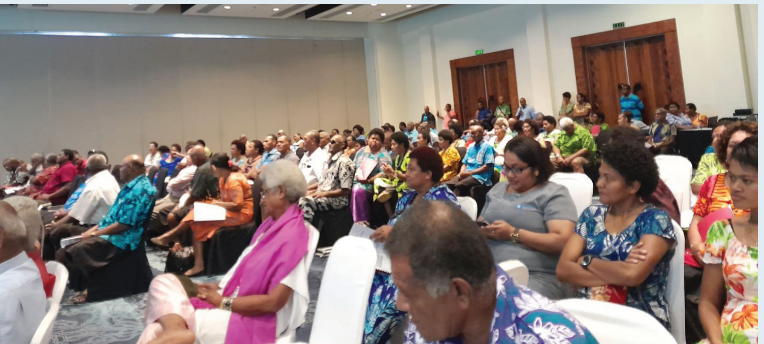
Bose vakayabaki ni Yavusa E Tolu mai Narewa mai Nadi