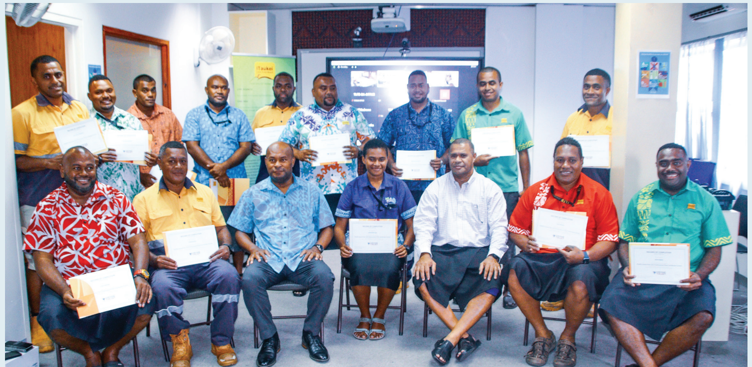
Eratou sa mai ciqoma na lewe tinikava (14) na nodratou sitivikiti ni pailatetaki ni drone

E sa tiko vakakina na vakanuinui ni Matabose ni ra na laki vakayagataka vakayalomatua na misini sau lelevu oqo na lewe 14 oqo, ka vakayagataka na nodra kila me laveti cake kina nai tagede ni veiqaravi ena loma ni Matabose ka vakauasivi na nodra marautaki na lewenivanua na veiqaravi e sa vakarautaka tiko oqo na TLTB. ■