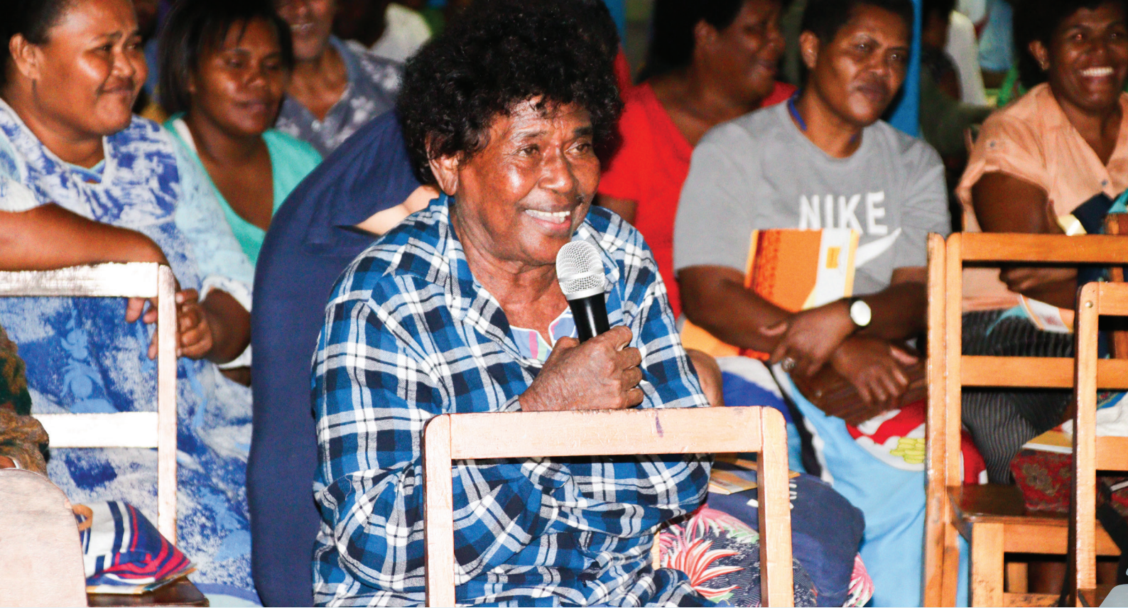
Veivakararamataki e na Nabua