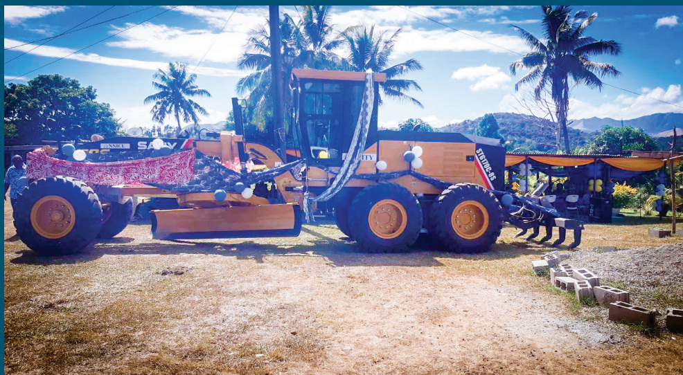
Na katavila vou ni Mataqali Nakoro