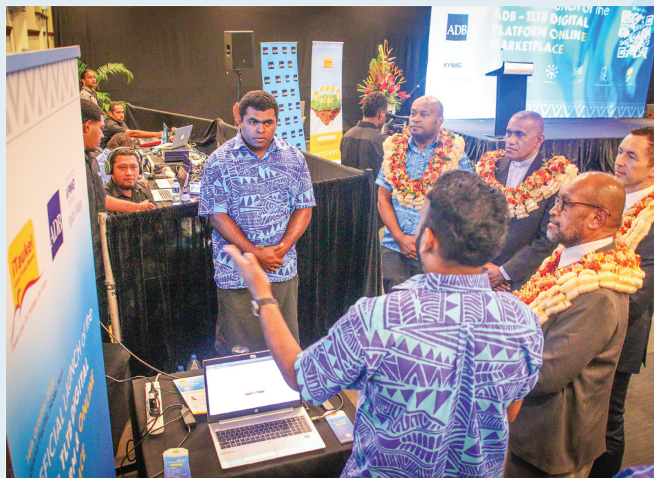
Nai vakamacala ni Online Marketplace

Eda vakavinavinaka talega vei iratou na KPMG ena nodratou wasea na nodratou kila me rawa ni mai vakaoqo nai rairai ni vatavata oqo. Vakavinavinaka talega kina Matabose ni Qele Maroroi (TLTB) ena cavu isausau oqo ka na kauta main a veisau levu vei ira na noda lewenivanua. ■