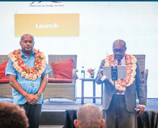
Tavoci nai vataavata ni veivoli ena mona livaliva - na Online Marketplace

Ni da lako curuma yani na yabaki vou, sa tiko na vakaniuini ni Matabose ni da na cakacaka vata me tokoni, me tosoi, ka vakarabailevutaki na vataavata oqo. ■