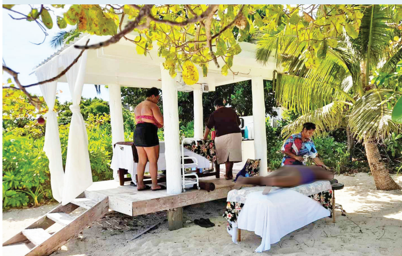
Oqori na Spa ena otela na Malamala Resort mai Nadi