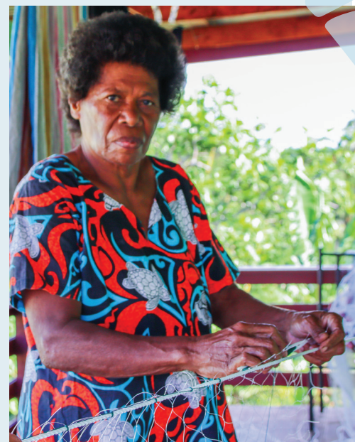
Ko Meri Siganiucu e botana tiko edua vei ira na tini na lawa ni qoli ka a sa qai volia vou na Mataqali