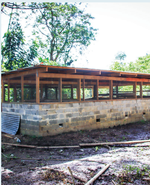
Bai ni vuaka ni Mataqali