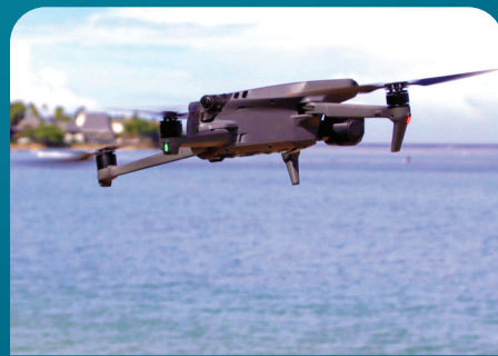
Na imatai ni Drone ka a volia na Matabose me veivuke ena volau ni veiqaravi

E dina ga ni sau levu sara tiko na misini oqo, ia e marautaka na Matabose na nona volia baleta e vuqa sara na veika vinaka e veivuke kina ka ulabaleta vakadua na bibi ni kenai sau.