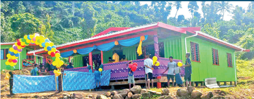
Marautaki na kena dolavi e 11 na vale ni Mataqali Navunivuvudi e Nadua Koro, mai Wainunu, Bua