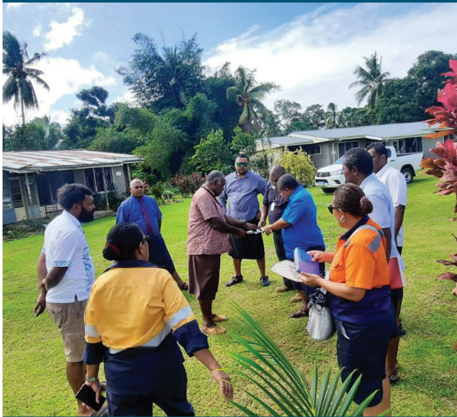
Vakadeitaki tiko nai yalayala ni koronivuli o Ratu Kadavulevu

E marautaka na Matabose me cakacaka vata kei na matanitu ena tikina oqo. Me vakarawarawataki na nodra semati mai o ira era lisi kina taoni kei na veiyasana tale ni veiqaravi eda dau gadreva wasoma. ■