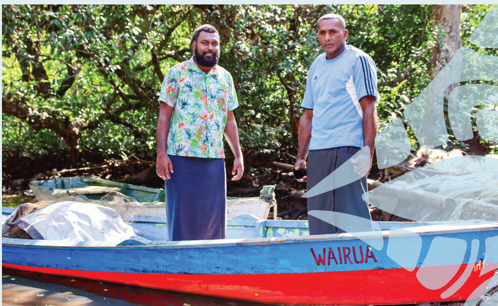
Na boto ni Mataqali Wairua

Oqo e dua na mataqali e sa toso vinaka sara tiko ena Vualiku kei Tailevu ka ni vakayagataka sara vakavinaka na kenai lavo ni lisi ka a se ciqoma ena vica na yabaki sa oti. Ena gauna oqo, e ratou sa gumatua sara tiko na kena Trustees me tuvalaki tale eso nai tuvatuva matau me qaravi ena dua na gauna lekaleka mai oqo me baleti ira na kawa ni Mataqali o Wairua ena veisiga ni mataka. ■