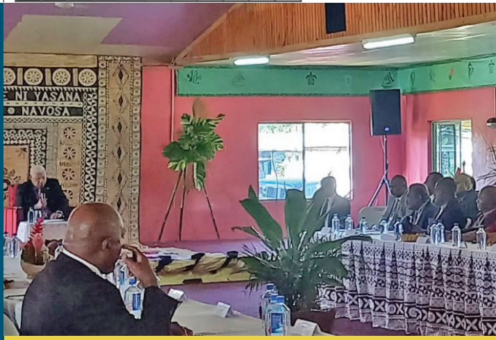
Bose ni Yasana o Nadroga