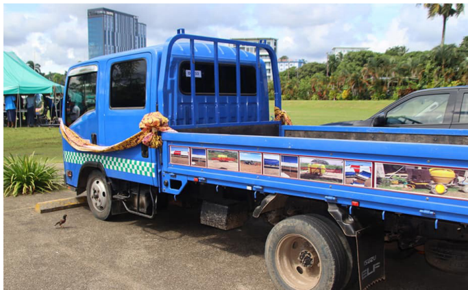
Lori ni Mataqali Sautorotoro

Ena gauna oqo e sa vakadonuya oti na Matabose e e 33 na kerekere main a 187 taucoko na ivola kerekere e ciqomi rawa. ■