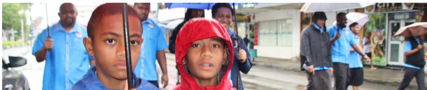
Vukei o ira na gone me ra taura e dua na iwase ni nodra sede me veivuke ena ka ni vuli ni bera ni ra yacova na yabaki 18