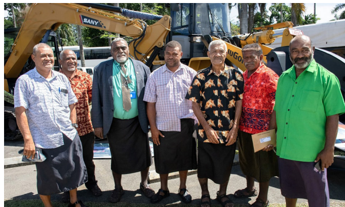
Vukei tale ga o Dreketi, Macuata

Ena gauna oqo e sa biu tale tiko ga vakatikitiki e