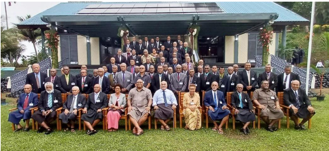
Na imatai ni Bose Levu Vakaturaga ena 2024 mai ena yanuyanu Turaga o Bau