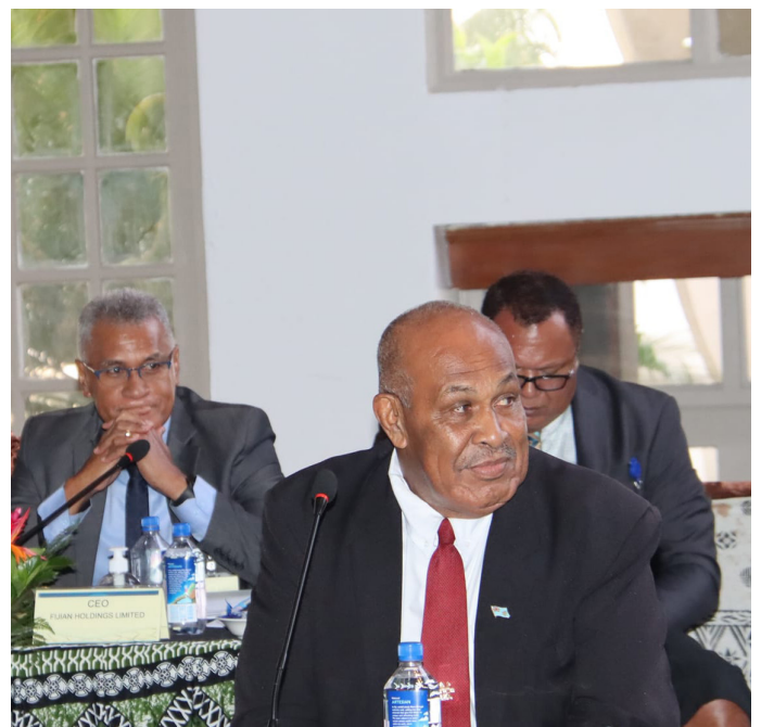
Vunautaki tiko na veivuke ni Tabacakacaka iTaukei ena vei Bose Ni Yasana