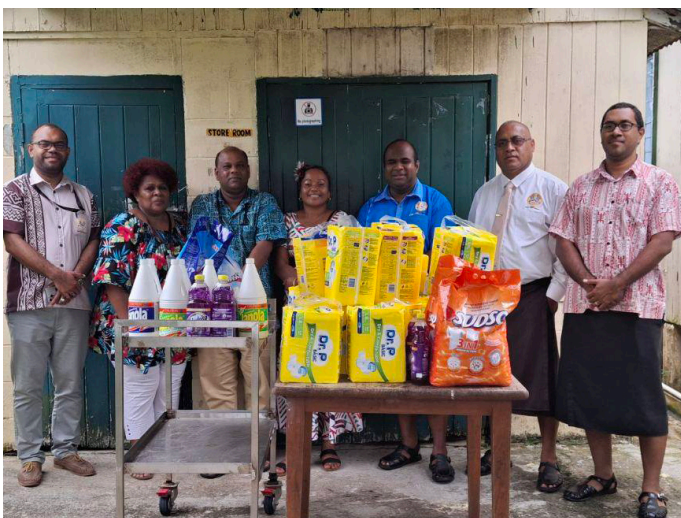
Veisiko na TLTB ena Samabula Old People's Home

E dau gauna namaki na Siga ni Sucu me vaka ni dau caka kina na veisikovi kei na veiveiraici ena iyaya se na kakana – na gauna ni loma soli.