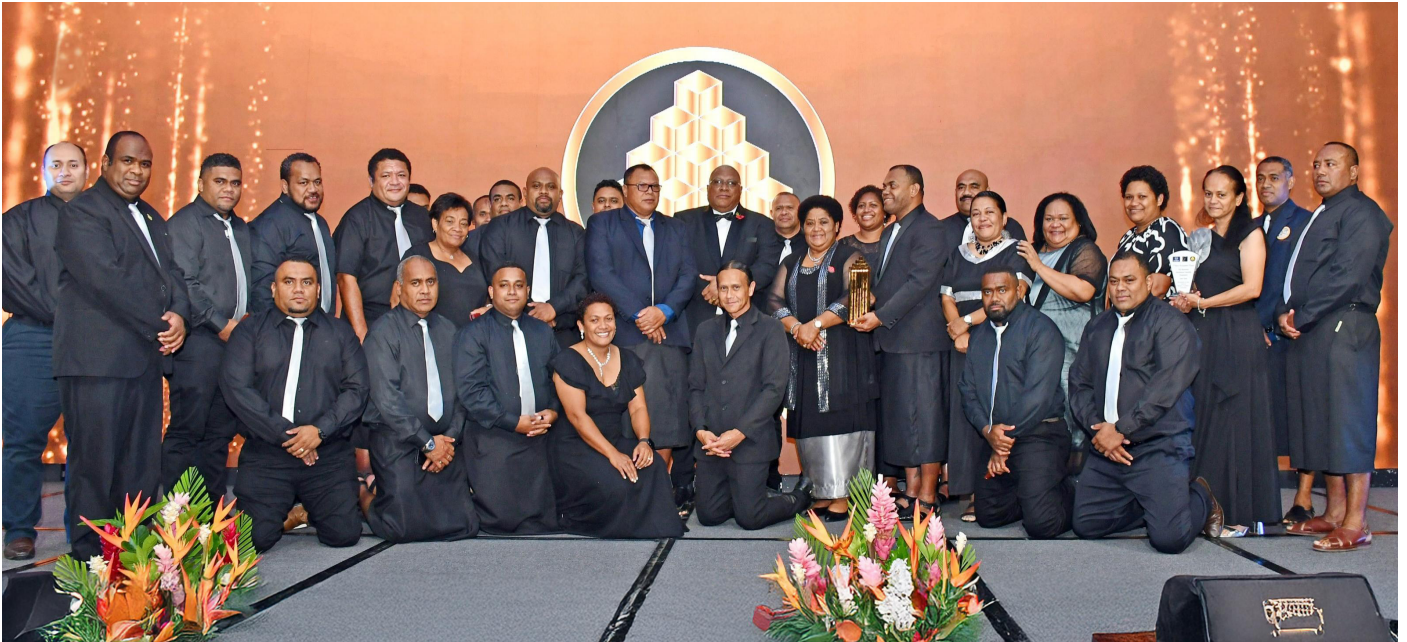
Ciqoma o TLTB na icovi levu na President's Award ena Fiji Business Excellence Award mai Nadi ena 2024