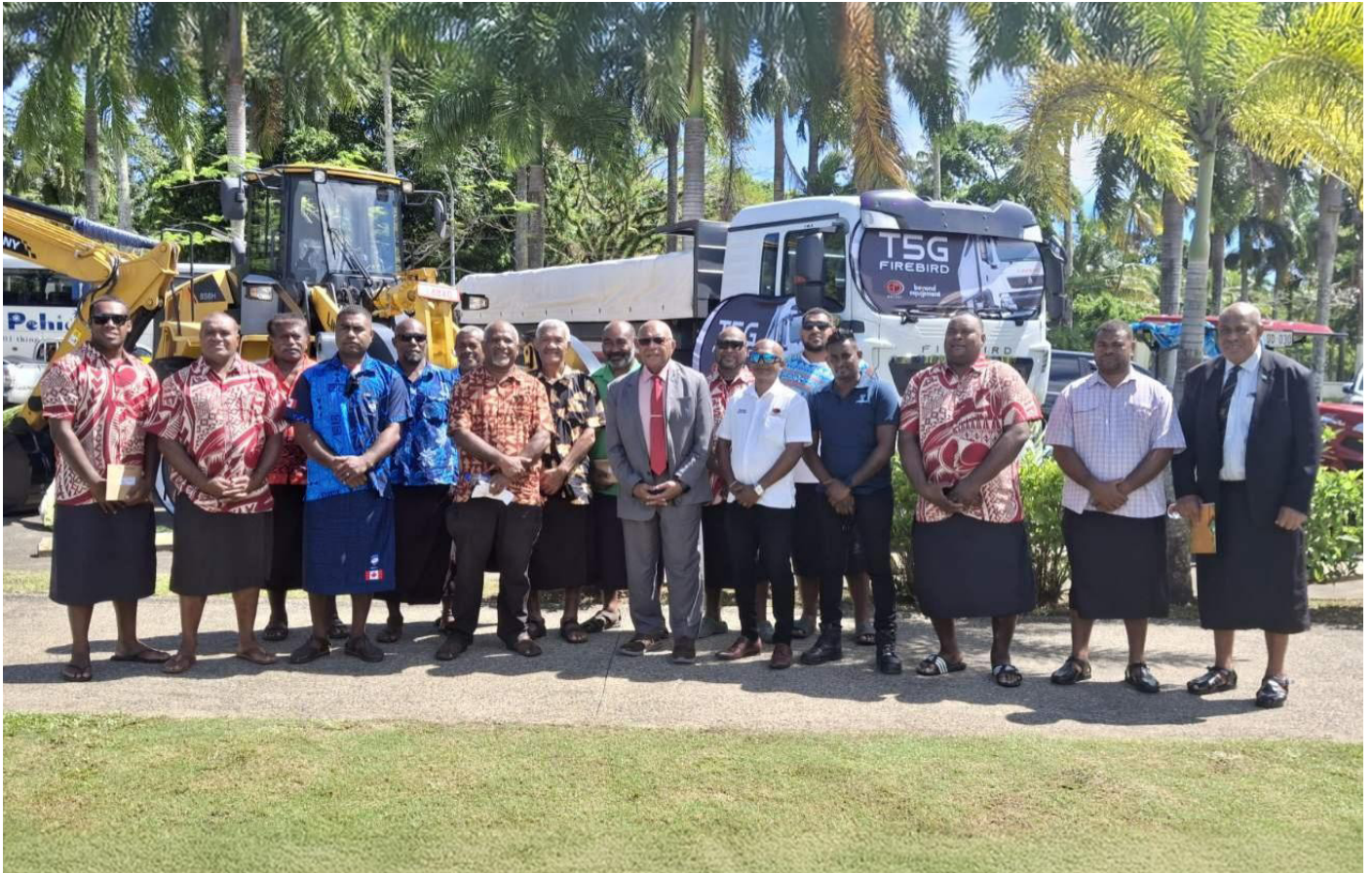
Mai solia na Turaga na Paraiminisita Sitiveni Rabuka ke ira na itaukei ni qele era sa mai ciqoma na nodra iyaya ka tauri ena ruku ni iTaukei Development Fund Facility