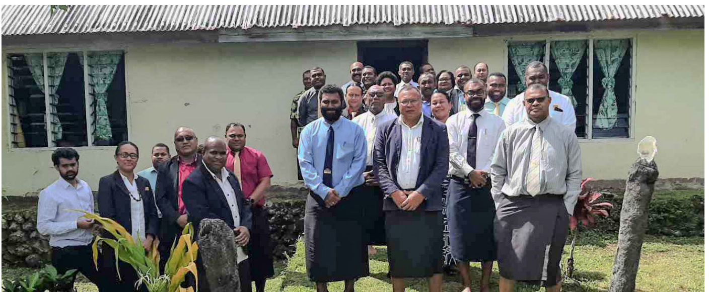
Toso tiko na bosebose-ka ni Matabose ena veikorokoro me vakavinakataka tiko na veiwekani ni TLTB kei ira na iTaukei