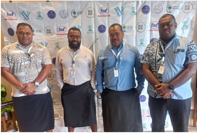
Tosoi tiko na nodra vuli na vakaillesilesi ena vuku ni veiliutaki

e 401 na Deed of Trust kei na 4101 na ituvatuva ni wasei nii lavo ni lisi se Assignment