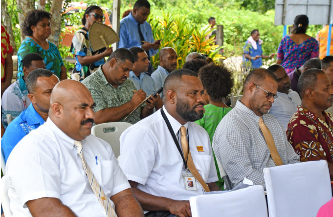
Dau qarauni me ra tiko na vakaillesilesi ena veivanua eso me rawa ni saumi na nodra vakatataro na lewenivanua