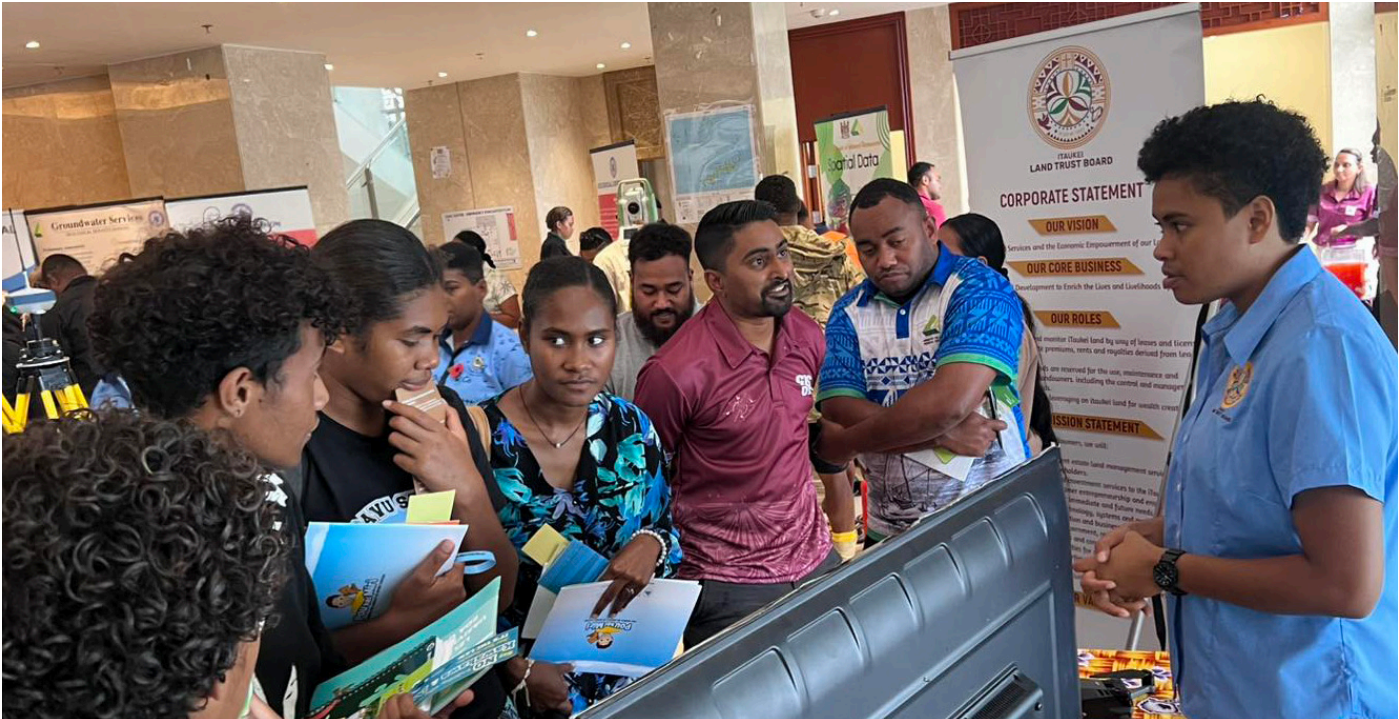
Oqori ena dua na soqo ka dau tovolei me wasei yani kina na itukutuku eso me baleta na TLTB kei na veika e dau qarava me baleti keda na lewenivanua