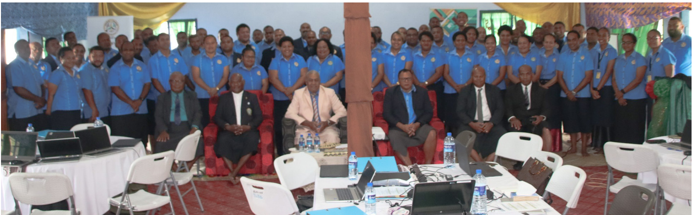
Taba toka oqori na Turaga na Tui Noco kei ira na lewe ni Matabose ni Manidia ena koro o Taci mai Rewa

E ra a laki tiko na veiman- idia eso ena veiyasai Viti ka ra vei qaravi ena Matabose ni Qele Maroro ena koro o Taci mai Noco, Rewa ena nodra Bose Vakayabaki siga rua (7 kei na 8 ni Noveba 2024) me tuvani kina na ituvatuva ni cakacaka ni Matabose ena yabaki vou, 2025.