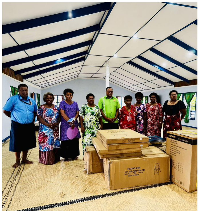
Veivuke ena koro o Taci, Noco, Rewa

Na nodra cau ki na iSoqosoqo Vakarama e ivakavinakavinaka ni nodra veiqaravi ena bose siga rua; wili tiko kina na isoli-soli me vaka na ivakatakata ni kakana, na katoniwailiwa, teveli kei na idabedabe; rauta tiko ni $3000 na kena isau vakailavo. ■