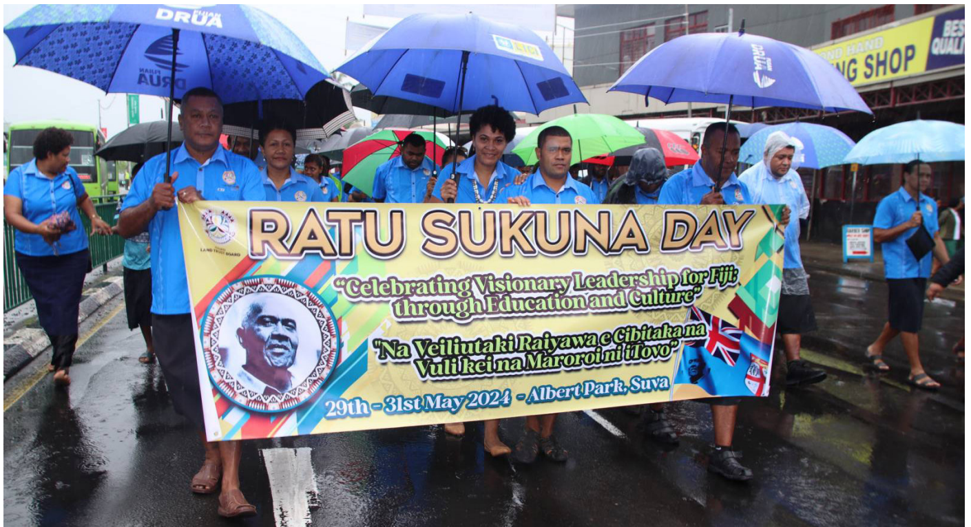
Vakaitavi o TLTB ena soqo ni Ratu Sukuna Day 2024