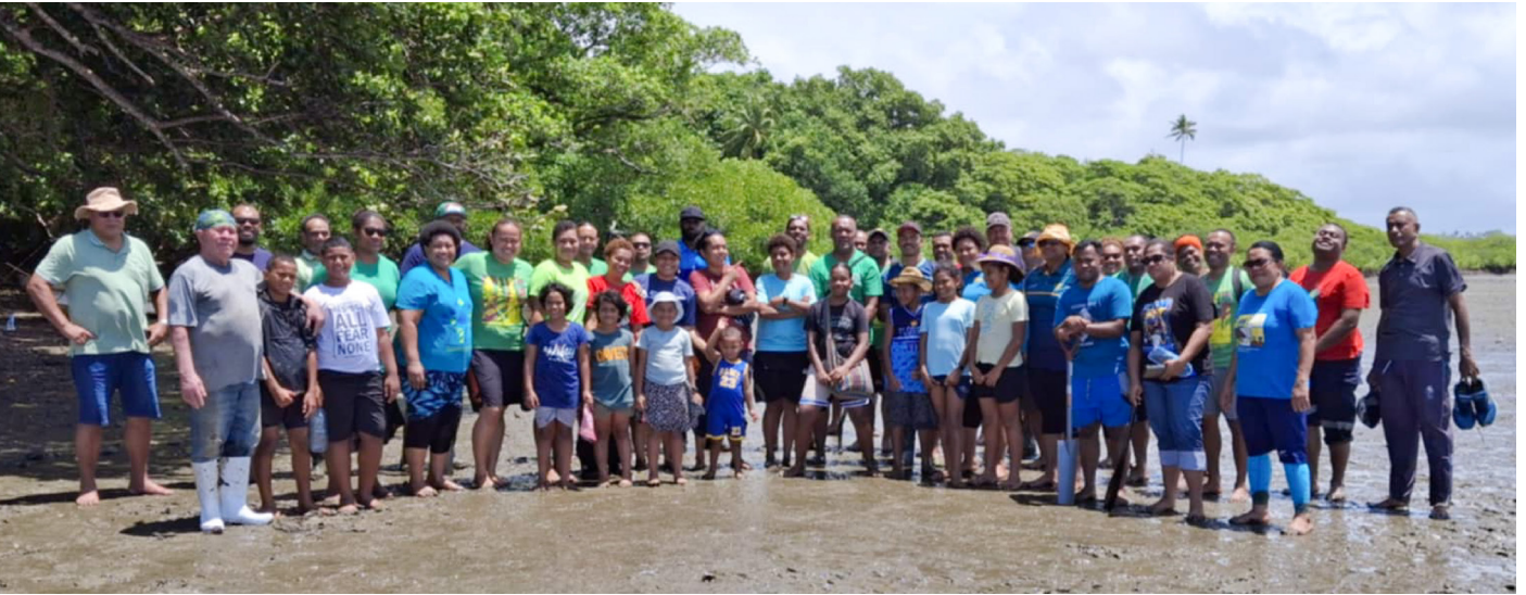
Tomani tiko na nodra cau na vakaillesilesi ena kena vakasaututaki na noda itikotiko e Viti me vaka na tei kau kei na tei dogo

na ivakadinadina ni isau ni veika e tiko e dela ni qele (Valuation Report)