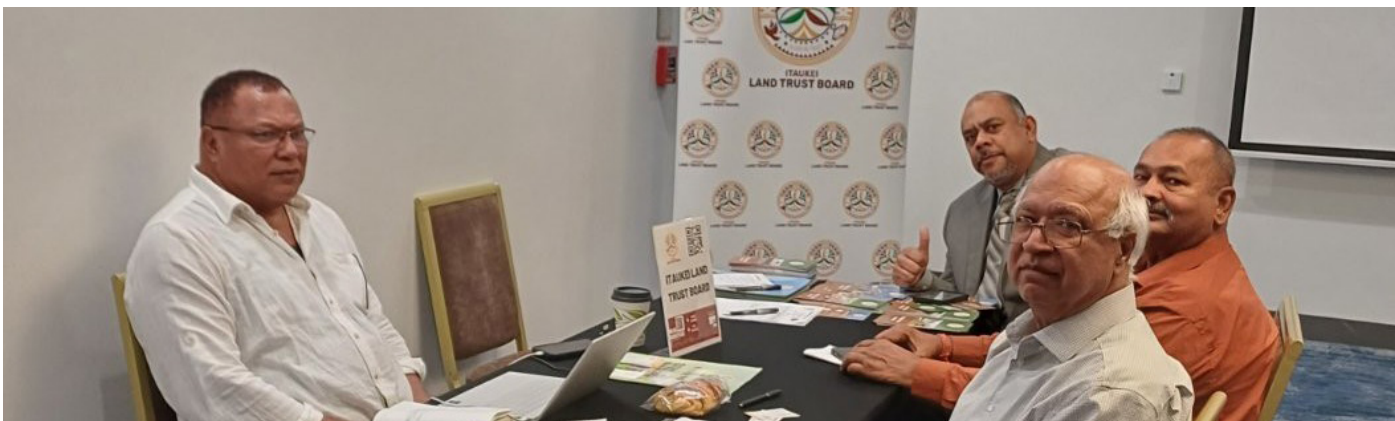
Sikovi o ira na wekada mai Amerika

E kalougata sara na Matabose ni Qele Maroroi ni a bau laki maliwai ira tu na veitabana vaka-Matanitu ena dua na igolegole ni veivakararamataki ena loma ni vanua levu o Amerika main a I ka 8- 13 ni Okotova 2024.