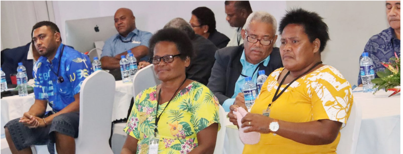
Sota o ira na iTaukei ena iTaukei Resource Owners Forum ka vakarautaka na Tabacakacaka iTaukei