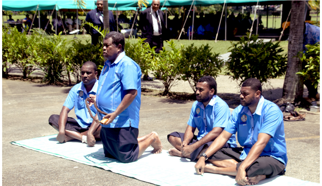
Veiqaravi vakavanua vua na Paraiminisita ka ratou vakaitavi kina na Tabana ni iTaukei ni Qele

"Au sa marau niu mai vakaitavi ena kena soli