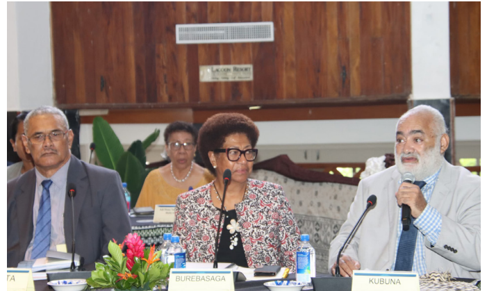
Dabe o Kubuna kei Burebasaga ena Bose Levu Vakaturaga

Oqo ena rawa ni vakad- abera e dua na yavu me qai vakamuani yani kina na iwali ni leqa me rawa ni va-qaqacotaki me tekivu sara ga ena noda veikorokoro se veitikotiko. ■