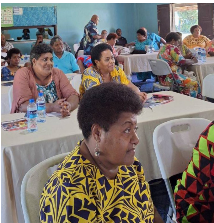
Taleitaki na veisemati ni Matabose vei ira na marama ni Nakuruvarua

E tomana tiko na Matabose ni Qele Maroroi na veivakararamataki ena macawa sa oti ka ra bau nanumi tale tu ga kina na marama ni tikina o Nasigatoka e Nadroga