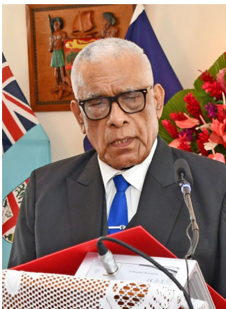
Turaga na Tui Cakau. Na Peresitedi o Ratu Naiqama Lalabalavu

E ra sa mai digitaki na Turaga Bale Na Tui Cakau o Ratu Naiqama Lalabalavu me ra sa veisosomitaki ena itutu vaka Peresitedi ni noda vanua.