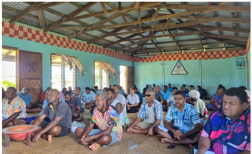
E dau vutucoqa na veitalnao eso me baleta na qele ena noda vanua