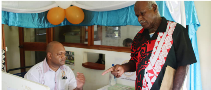
Matai ni lewenivanua me qaravi mai Vunidawa

E 1,023 taucoko na lisi; ka levu ga na lisi na teitei; ka ra sa wasea oti na itaukei ni qele e kea e $2.6 na milioni ena yabaki oqo (2024). ■