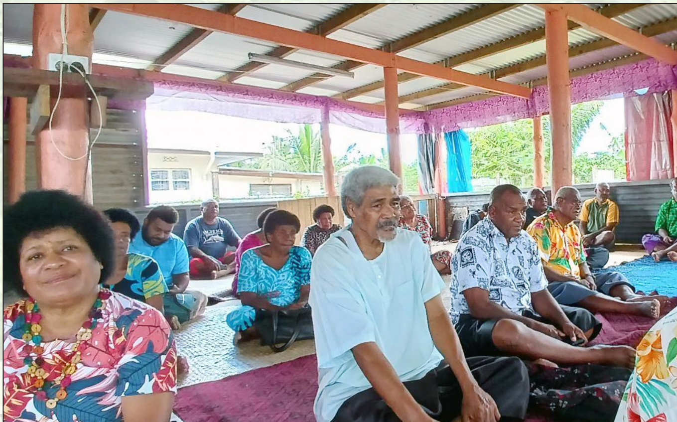
Oqori o ira na lewe ni Yavusa Mataisau ena nodra lako ciqoma na vosabubului me baleta na nodra qele