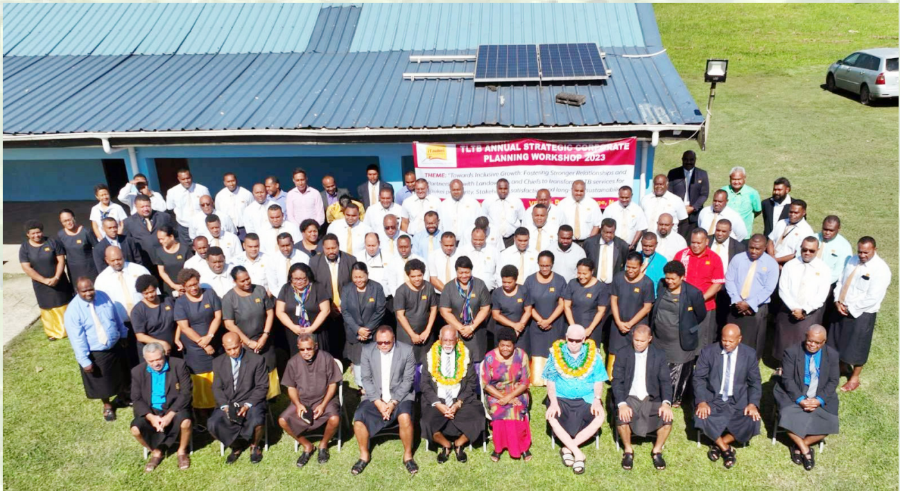
Matabose ni Itaukei Land Trust Board, Manidia, Vakalesilesi e cake kei ira na i Taukei ni qele mai Dratabu, Nadi.