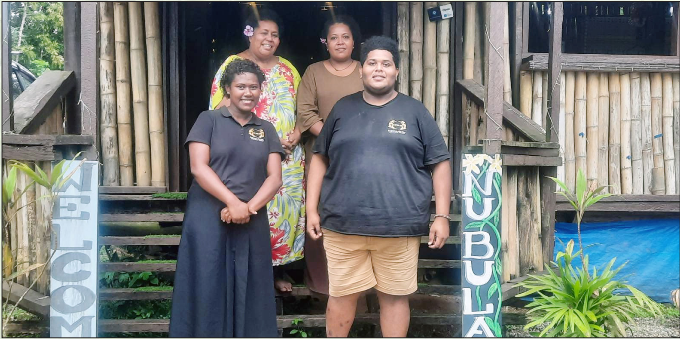
Oqori o Elenoa Nimacere kei iratou na luvena ena mata ni nodratou vale ni kana ... toka fikiva na koro o Nawabena, Naitasiri

Na kena mai tauyavu na Veikau Lodge ena yabaki 2022, e vaka e mai kureitaka talega na Vanua taucoko o Naitasiri. E vakila na vanua o Naitasiri na nona mai dabe na marama oqo ena