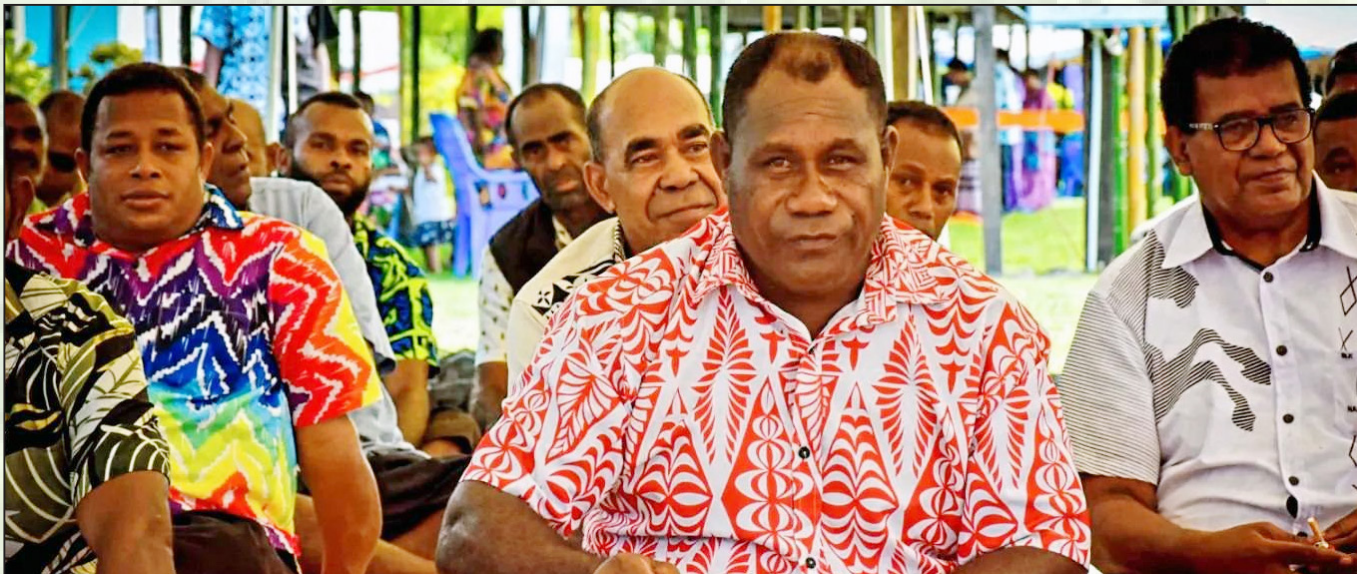
E rui bibi me da kila na noda dodonu, me rawa ni da kila na veika me da cakava kina