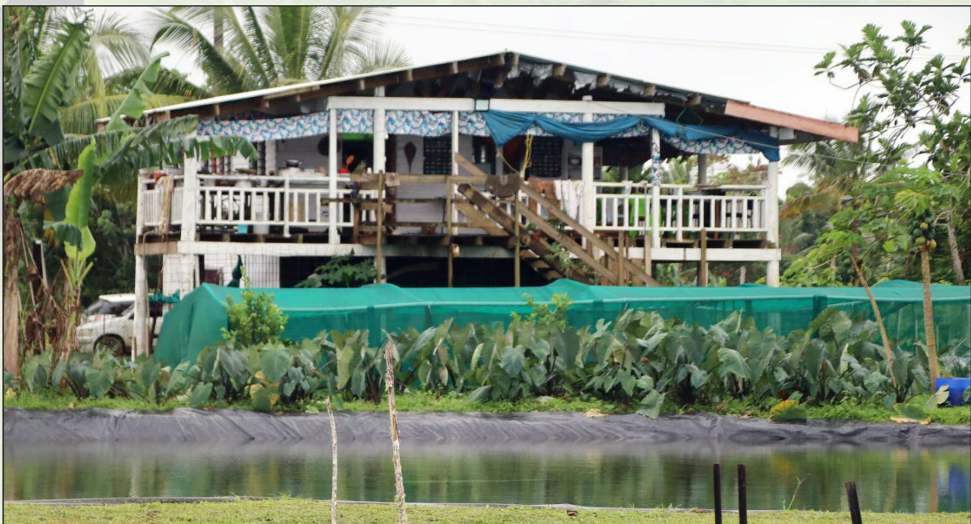
Na vale ni kana ena KayBee Farm e Nakasi ... na vanua e qaravi fiko kina na kana kei na vuli me baleta na teitei kei na susu ika