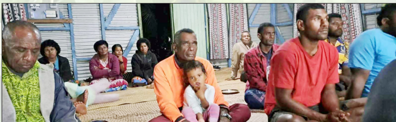
Veivakararamataki ni Matabose mai Nawailevu, Bua