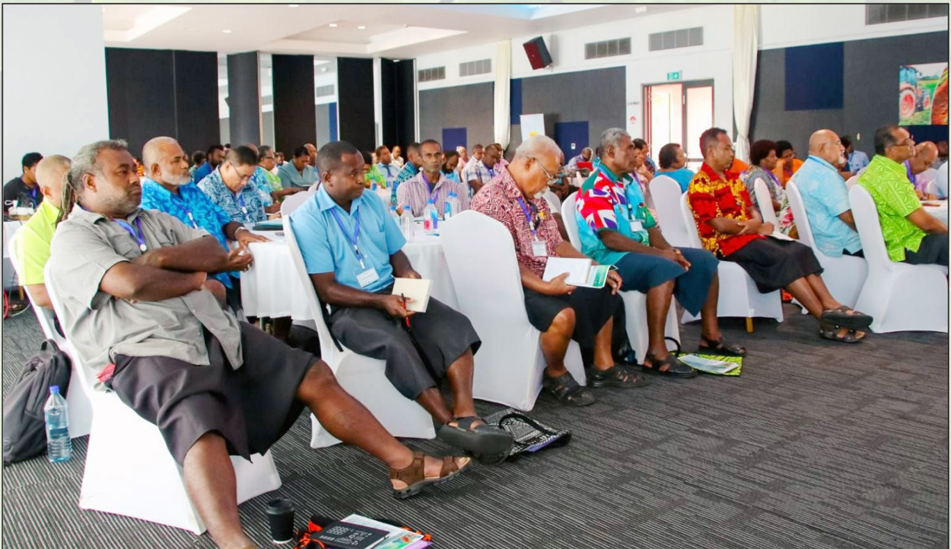
O ira na itaukei ni qele ka ra sa maqusa me ra rogoca na sasaga esa mua kina na kawa iTaukei ena nodra imatai ni dabevata na nodra veivosaki kei na vuli ka vakatokai na Resource Owners Forum 2023

Ia sa nakinaki tiko na Tabacakacaka iTaukei ni oqo e se qai kenai sevu ka sa na yaco me ituvatuva tudei na mataqali veitalanoa vakaoqo. Sa vakanuinui vinaka tiko na Matabose ni na levu sara na veika vinaka ena basika mai vakauasivi ena kena vakatoroicaketaki na noda bula na kawa iTaukei. ■