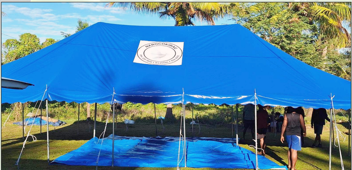
Oqori na valelaca ka dau vakarautaka o Aminiasi me nona ivurevure ni lavo

E ratou duavata vakaveitamani ena kena vakadavori e dua nai vakadei ni kena tosoi na veika vakabisinisi. Oqo me rawa ni veiraurau kei na nona sasaga ni vuli torocake me veidutaitaki kei na nonai tuvatuva ni rawa ka vakailavo ena gauna mai muri. Oqo sa dua nai vakaraitaki vinaka ni sasaga yaga ka raiyawa, gumatua kei na gadrevi ni bula torocake. ■