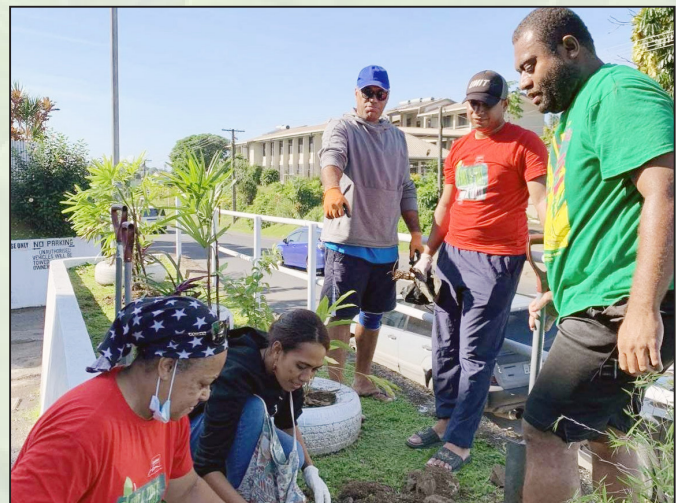
Maqusa o ira na vakaillesilesi ena sasamaki

Sa dua na veisau levu e laurai votu ni oti na nodra qaravi tavi, vakabibi ena kena vakasavasavataki na valenibula kei na kena tautuba. Ia oqo e dua nai tavi e dau veivakauqeti kina ka tokona talega vakalevu na Matabose. Na noda kauwai tiko ena veivanua eso e vakavolivoliti keda, ka vakauasivi ena noda