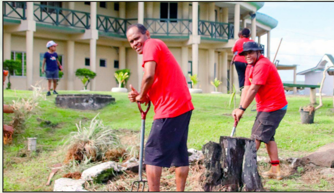
Samaki ka teivaki vou tale na senikau ena lomanibai ni koronivuli mai Ratu Sukuna

Me vaka ni a tauyavutaka talega na Matabose ni Qele Maroro'i na turaga nai talai o Ratu Sukuna, e veiganiti vinaka nai naki oqo kei na gauna e a laki vakayacori kina.