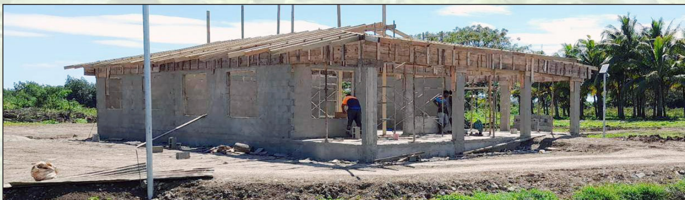
E dua tale na vale ka tara mai na ilavo ni lisi ena koro o Lauwaki, Vuda