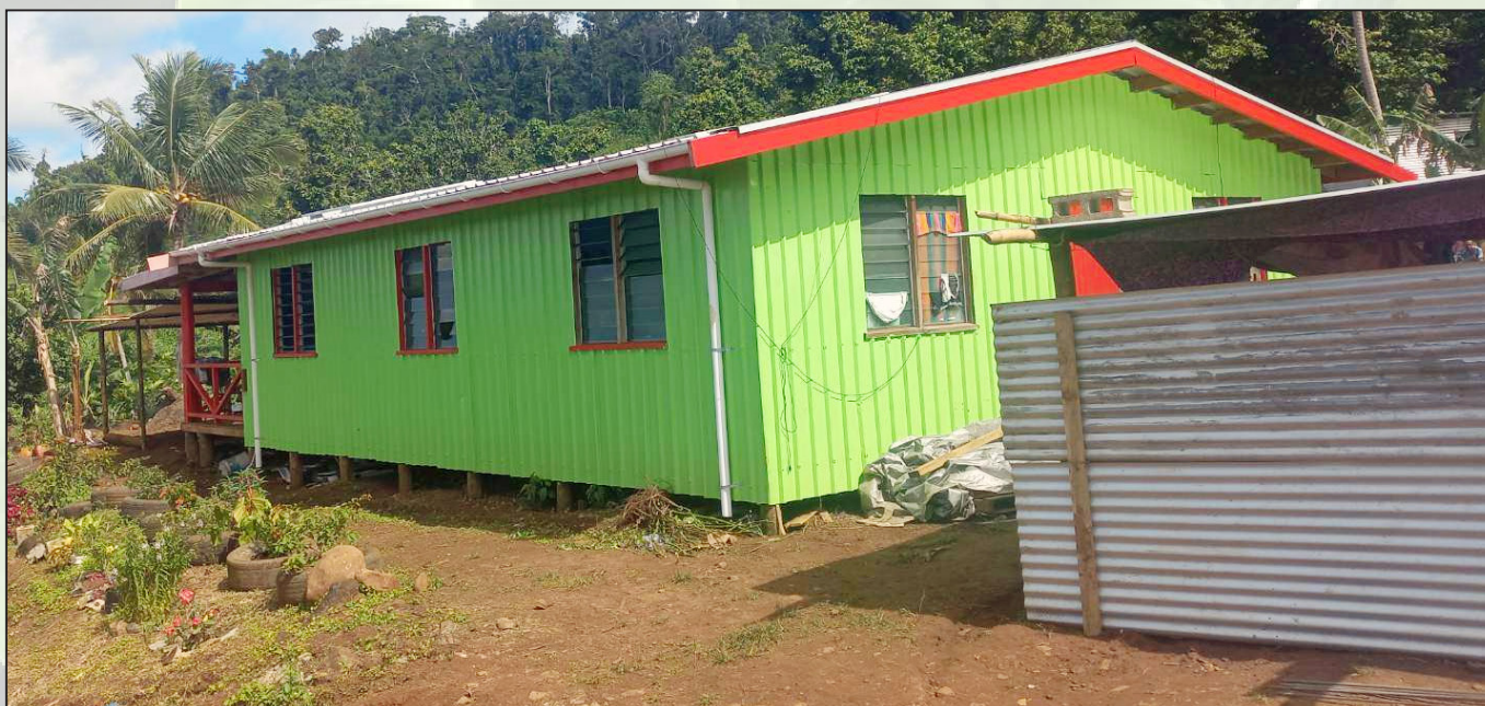
Oqori e dua vei ira na vale ka tara ena loma ni Tokatoka o Navunivuvudi ena koro o Nadua, Bua ... mai na ilavo ga ni nodratou lisi

Sa tiko na nodratou vakanuinui na lewe ni tokatoka oqo ni na vuqa na veigauna vinaka ka na vuavuai vinaka talega na sasaga ka sa mai tauyavutaki rawa oqo. E ratou tukuna ni oqo e dua na sasaga yaga sara baleta e vakanamata kina nodratou kawa mai muri. ■