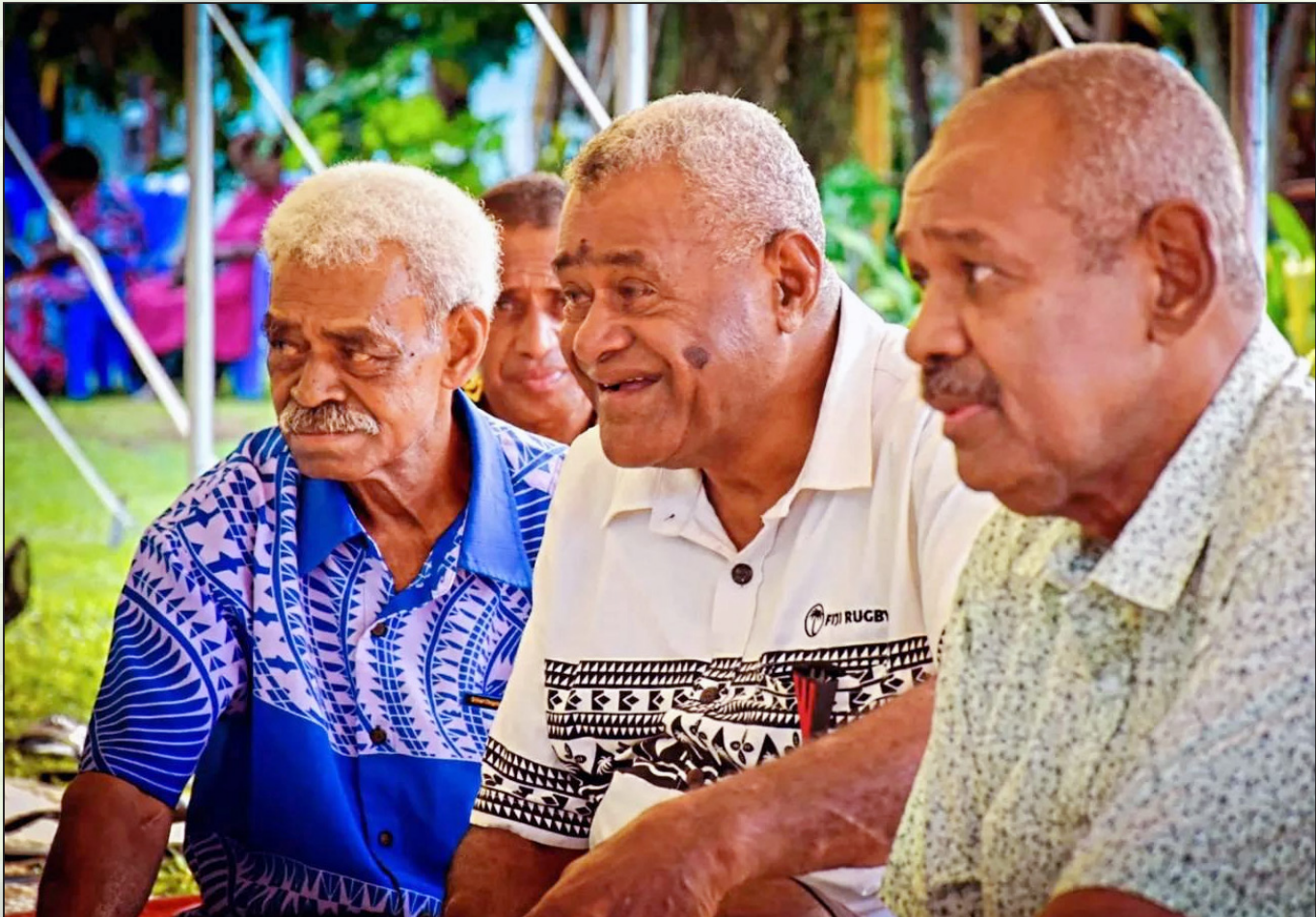
E vakabibitaka tiko na Matabose na nodra dau rogoci na domodra na itaukei ni qele kei ira na lewenivanua ena kena cicivaki tiko na veika me baeta na qele e Viti