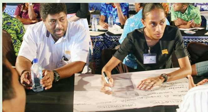
Matatiki tiko na Matabose ni Qele Maroroi ena veivosaki ni veivakatoroicaketaki mai na Vualiku ena Wasawasa Lodge

Ka usutu levu ni vuli oqo me ra mai dikeva vata, rai lesuva, ka veitalanoataka vata kei ira na veisoqosoqo tale eso, kei ira nai taukei ni qele na veigaunisala eso e rawa ni vakavinakataka kina eso nai tuvatuva me vaka na Carbon trading, na susu oni kei na vuqa tale.