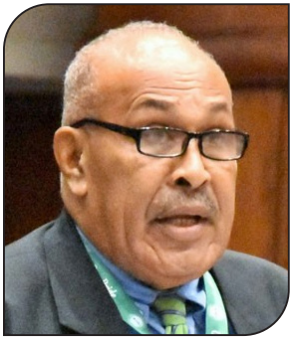
Hon. Ifereimi Vasu