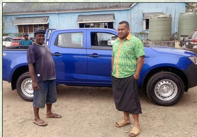
Ni oti na kena mai voli na lori ni mataqali o Vitadra

Sa na veivuke sara vakalevu na lori oqo ena veivakaleleci kei na nodra qaravi vakavinaka na lewenivanua. Ia, e mai rawa oqo