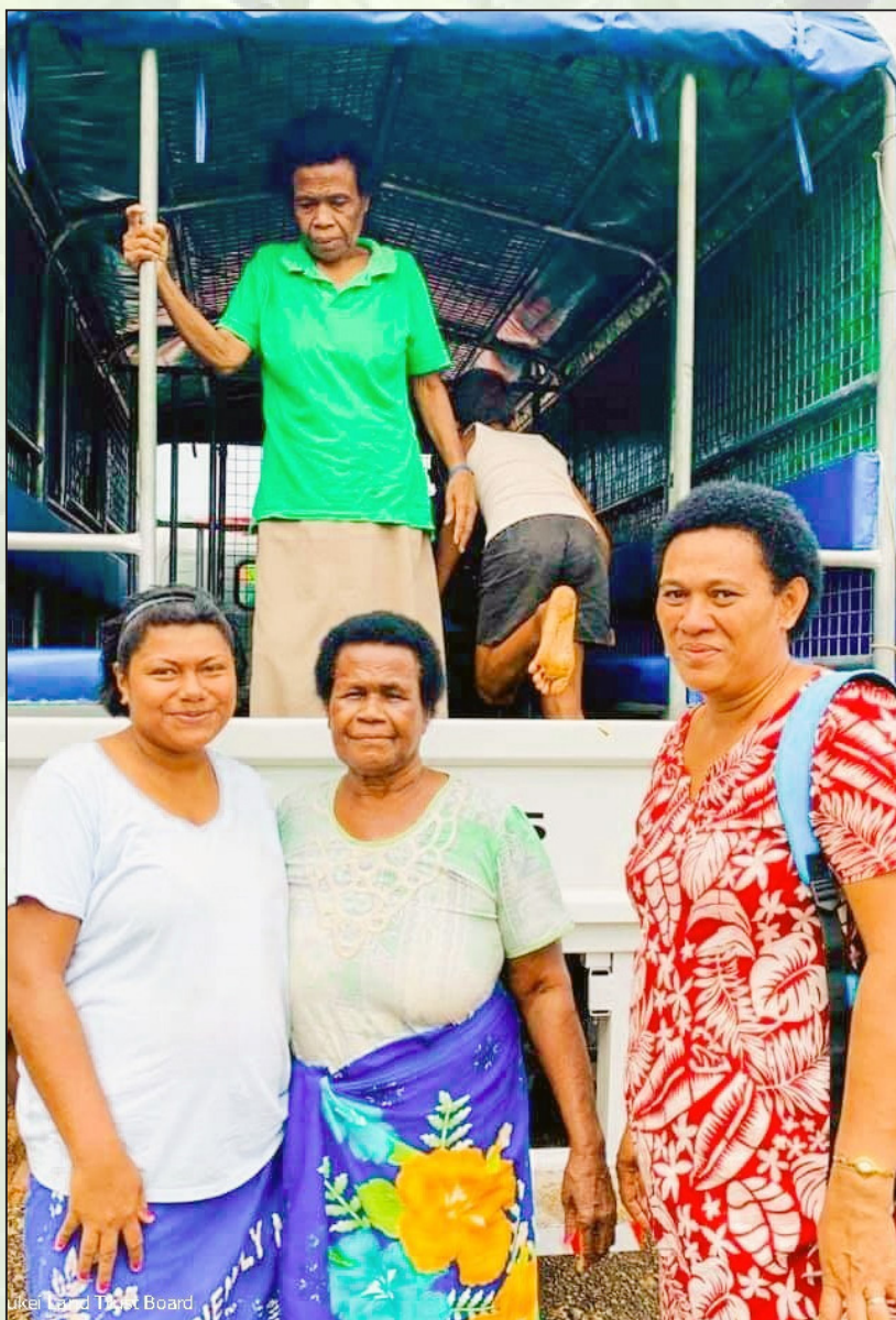
Volia tale nai Tokatoka o Nadua e dua na nodratou lori vou

Ia na Matabose ena tomana tiko na nona veivakasalataki kei na nona veituberi me rawa ni yaga ka vakayagataki vakamatau nai lavo ni lisi me rawa ni vakatoroicaketaki talega kina na nodra bula na lewe ni mataqali. ■