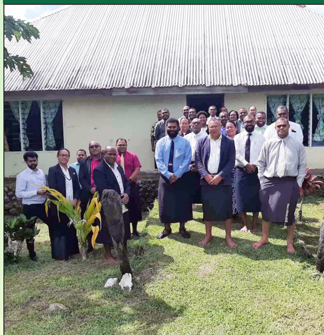
Oqo ni ofi na nodra bosa vakavula na manidia e na koro ko Navutulevu e Serua