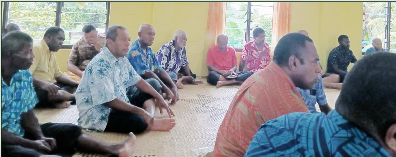
E bibi me da kila na itakei ni qele na noda dodonu vaka-itaueki ni qele