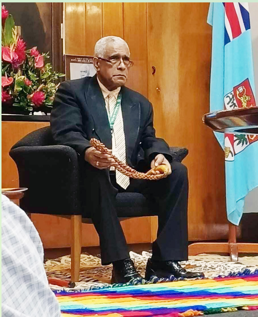
Ciqoma tiko o Ratu Naiqama na kedra iqalovi ena nodra siko mai ena TLTB

E luvuci na lomana na Turaga oqo ni sa oti e rauta ni 30 na yabaki qai sikova tale mai kina na Matabose mai na gauna a cakacaka voli kina ena TLTB me yacova mai oqo.