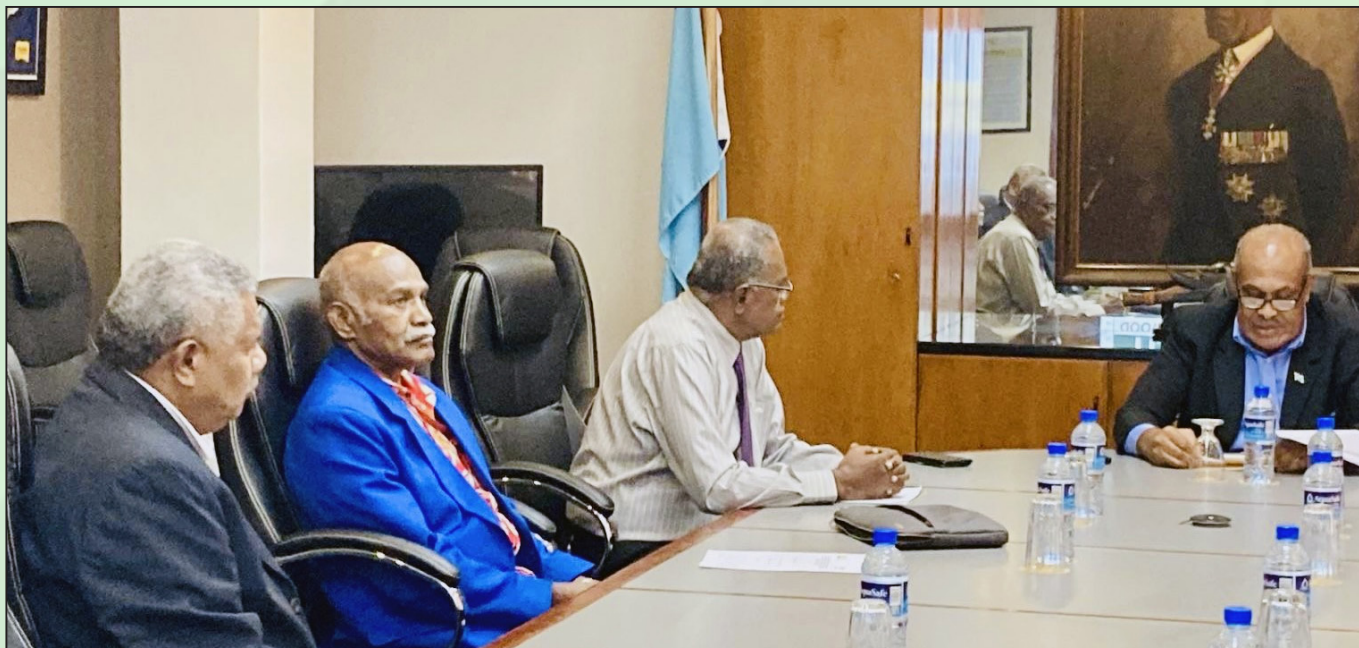
Veitalanoa ni oti na kena soli na jeke ka sauma kina na Fiji Hardwood na nodra ilavo na itaukei ni qele ki na Matabose ni Qele Maroroi