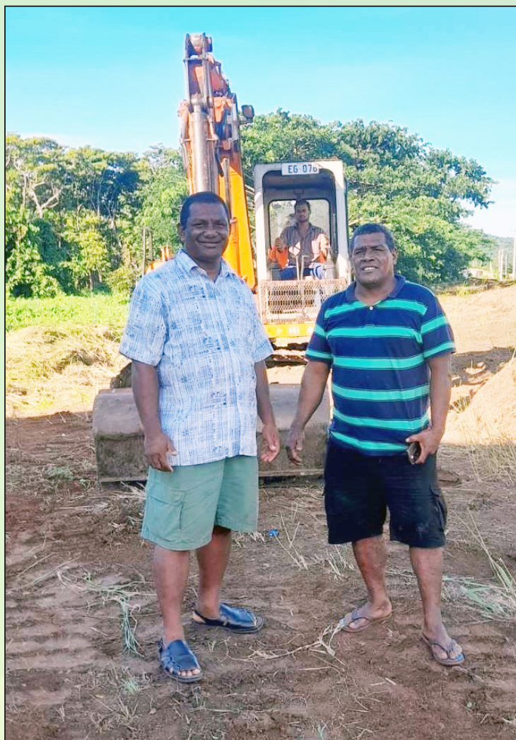
Tekivutaki na cakacaka ena Mataqali Serau e Dreketi

Oqo na nodratou i tuvatuva me tara e dua na vale ni caka bisinisi (commercial building) me na rede taki ena veibisinisi eso me vaka na sitoa ni veivoli (supermarket), vale ni madrai, vanua ni moce, valenikana, vale ni volitaki i sulu kei na buli wai cevata (ice plant). Oqori na itaba ni vanua sa vakasavasavataki tiko me ratou lisitaka na Mataqali ka me vakayacori kina na nodratou veivakatorocaketaki e Dreketi. ■