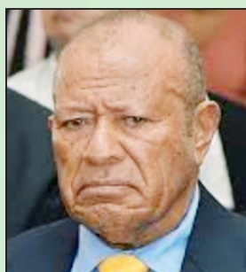
Turaga Na Qaranivalu, Ratu Inoke Takiveikata

Era vakavinavainakataka sara vakalevu o Ratu Inoke ena