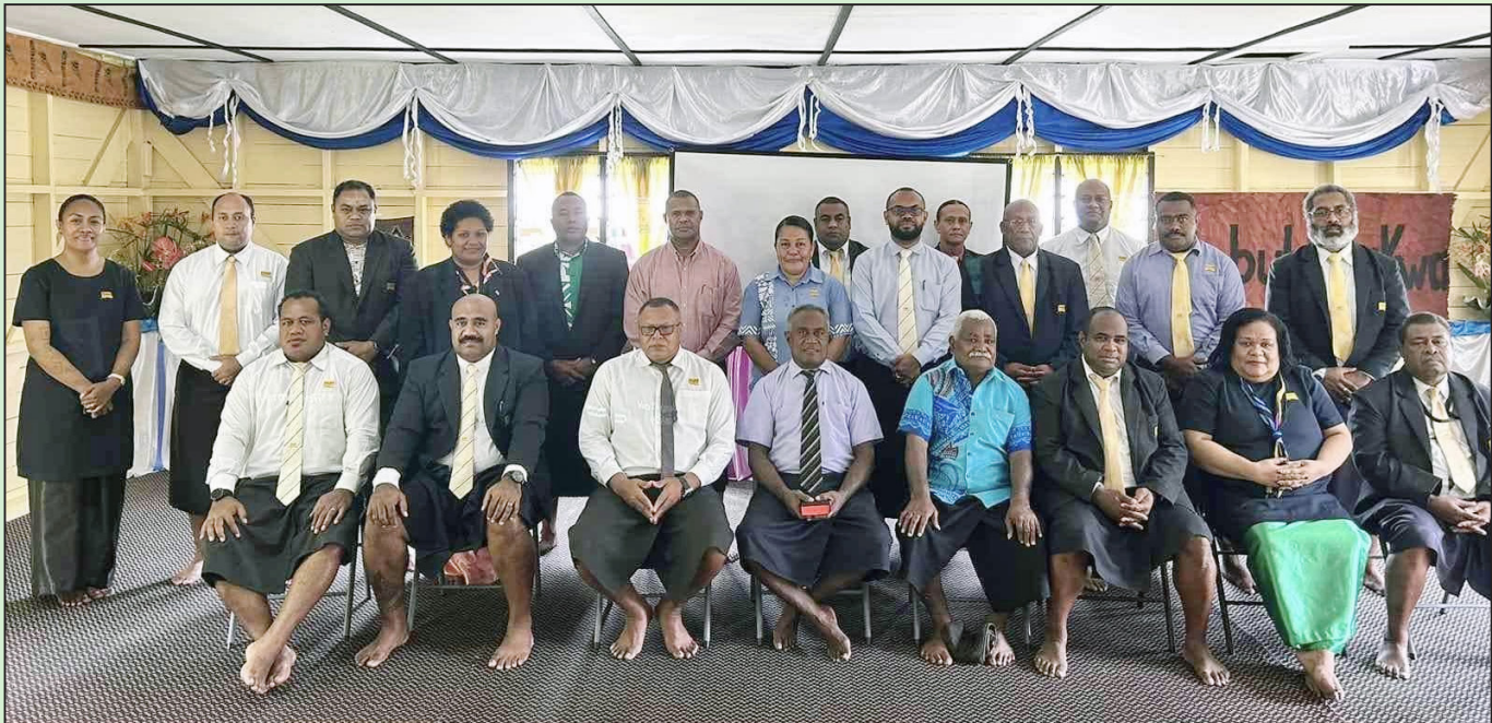
Veisiko kei na veivakararamataki ni Matabose ni Qele Maroro ena vanua vakaturaga o Nabukebuke

E kuria o Vasu, “e kenai balebale oqo ni so na qele ka sa vakalutumi oqo e na kauta lesu mai e rauta ni dua na drau vakacaca na udolu ($100,915) nai lavo ni lisi vei ira eso nai kumukumu ka sa vakalutumi oqo vei ira na qele”. ■