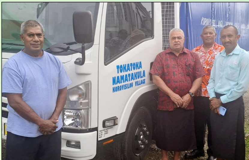
Na tolili vou ni Tokatoka o Namatakula, Korovisilou, Serua kei iratou na trustees

Ia e dua na ka e matalia kina na Tokatoka Namatakula. Na vuna oya ni sega in voli na keria oqo enai lavo ni lisi. E ratou sa kumuni lavo tiko mai na lewe ni tokatoka oqo ena vica na yabaki sa oti ka maroroi tiko mai me yacova na gauna e ratou