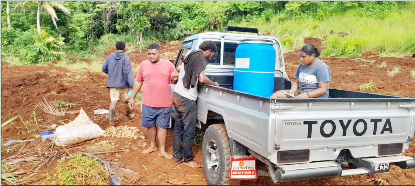
Toso tiko ga na vakayagataki qele ena nona ifikotiko o Turaga ni Mataqali o Devo e Seaqaqa, Macuata