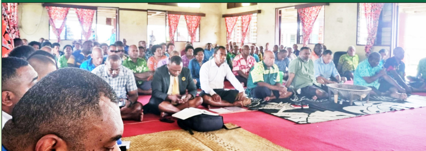
Osodrigi na loma ni valenisoqo ena koro o Tavua ena gauna ni veivakararamataki ni Matabose ka liutaka tiko na Vunilewa o Solomone Nata