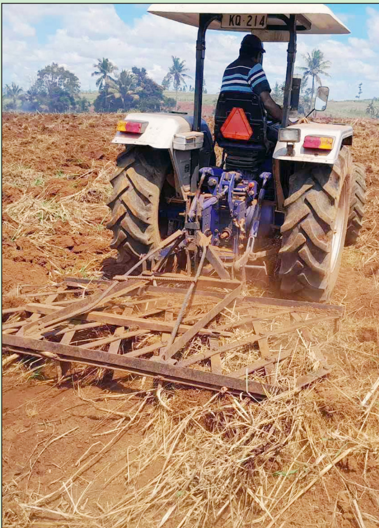
Vakayagataki tiko na misini me vakatotolotaka ka vakarawarawataka na teivaki ni qele